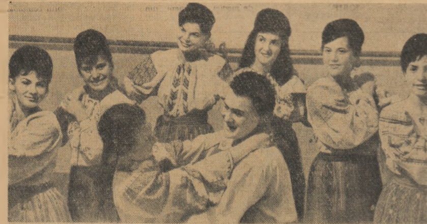
La Școala populară de artă din Oradea, cercul de coregrafie pregătește un nou spectacol

● Pe șantierul Combinatului chimic de la Craiova, lucrările de construcții se desfășoară în ritm susținut. La unele obiective, montajul a fost terminat sau se află în fază finală. La fabrica de amoniac, de pildă, montajul agregatelor și instalațiilor este pe terminate. Aici au fost montate o parte din utilajele mari, cum ar fi compresoarele de azot, de amoniac și de gaz convertit, liniile de conversie etc. Rezultatele obținute se datoresc folosirii unor metode avansate de lucru pe șantier.