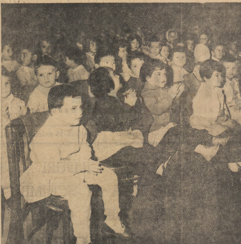
Applauze la scenă deschisă