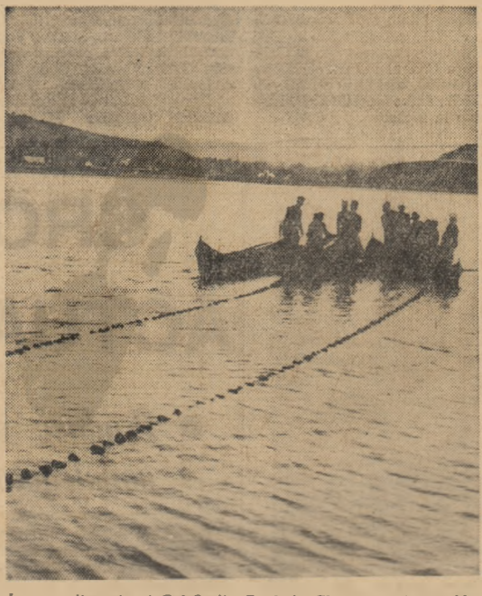
La pescuit pe iazul G.A.S. din Zău de Climpic, regiunea Mureș-Autonomă Maghiară