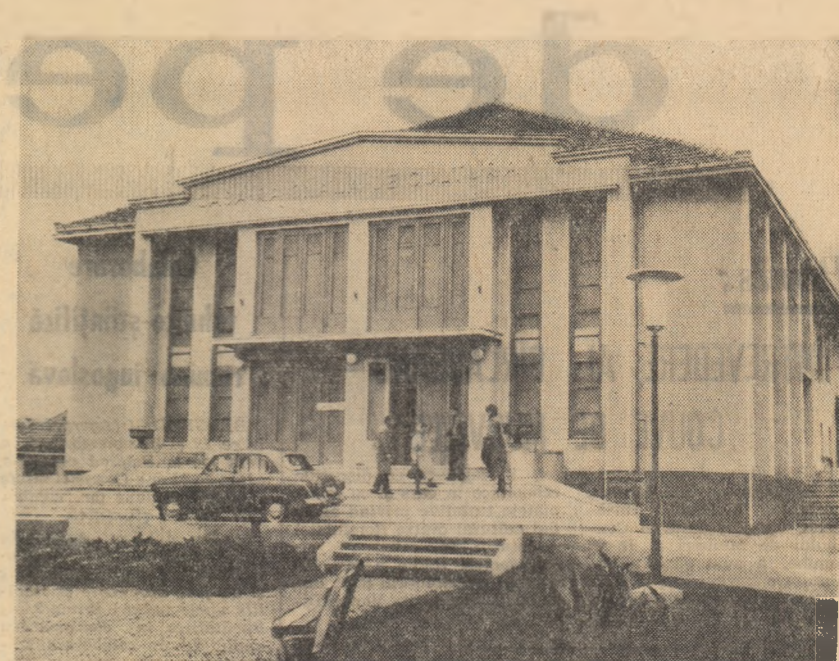
Casa raională de cultură din Aleșd, regiunea Crișana