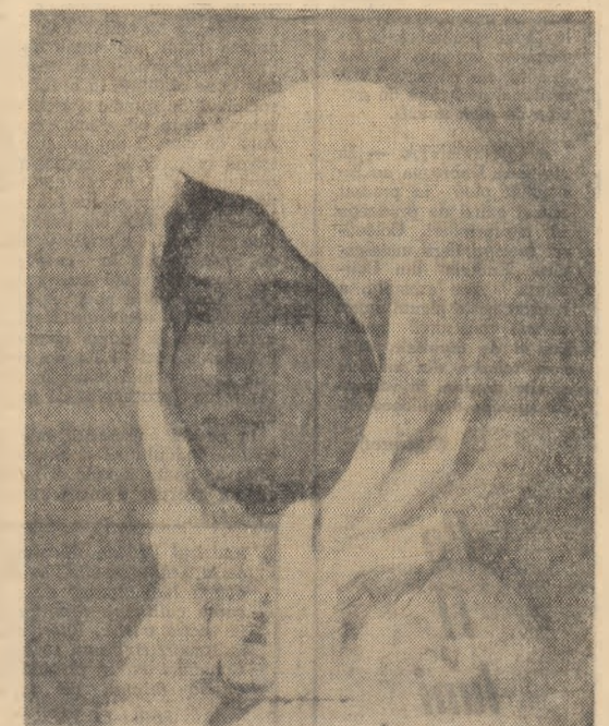
N. GRIGORESCU: Cap de jîrîncuță

istică însă, vînatul nu se reduce numai la urmărirea și împușcarea pradă. Vinătorii muzeiști studiază animalele în mediul lor natural, le observă cu atenție mișcările, pozițiile caracteristice pentru ea și atunci cînd vor deveni expozate să semene întocmai cu cele din natură. Orice exemplar colecționat pentru muzeu este cercetat cu multă atenție. Mamiferelor mari se jupoaie, pielea se argăsește. În același timp se construiește un corp artificial egal ca mărime cu animalul sacrificat. Corpul e modelat din ipsos sau dintr-o pastă de hîrtie care se acoperă cu un strat de lac sau