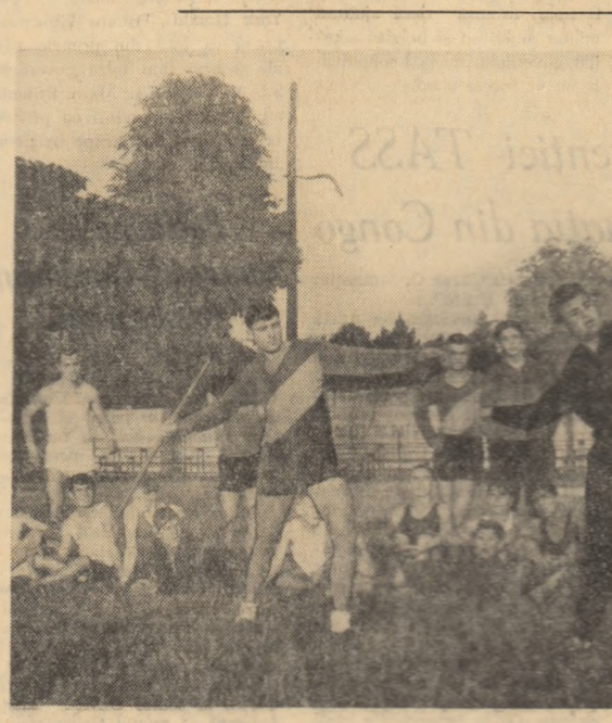
La Școala profesională de siderurgie din Oradea Rosu, elevii învață, sub îndrumarea profesorului de educație fizică, aruncarea suljei

Prin tradiția ei progresistă ilustrată de personalități ca profesorii Parhon și Obreja, psihiatria românească s-a dezvoltat în strînsă legătură cu problemele sociale. Datorită condițiilor create în ultimii ani, folosirii unor mijloace de investigații și metode terapeutice moderne, mortalitatea în clinicile de psihiatrie din țara noastră se situează printre cele mai scăzute din lume.