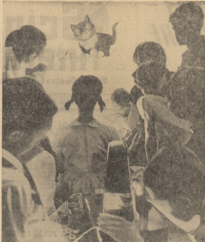
La una din camerele pentru copii ale blocului 11 din Șoseaua Giurgiului se vizionează un basm