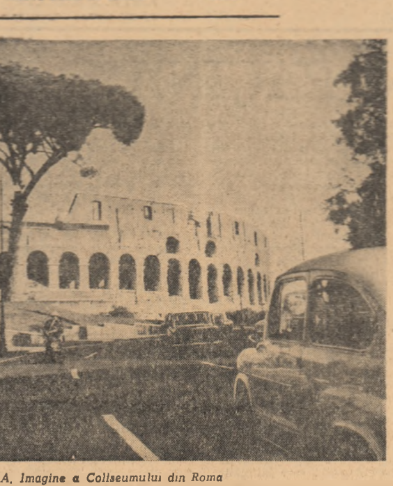
ITALIA. Imagine a Coliseumului din Roma

Președintele Makarios a spus că desființarea acestor baze este indispensabilă unității Ciprului cu Grecia. El a afirmat că desființarea acestor baze este indispensabilă unității Ciprului cu Grecia.