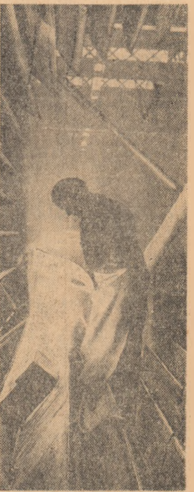
Uzinele „Grivița roșie” din Capitală. În secția cazangerie se execută montajul interior la o coloană chimică

teaza pe scară largă o serie de materiale plastice noi, pe suport textil, în deosebi la mobilier, care le dau un aspect mai plăcut. La Autobuzele urbane a fost suspendat un rînd de scaune, făcîndu-se astfel mai mult loc în interior. De asemenea, zgomotul autobuzelor și troleibuzelor a fost redus printr-o mai bună izolare fonică.