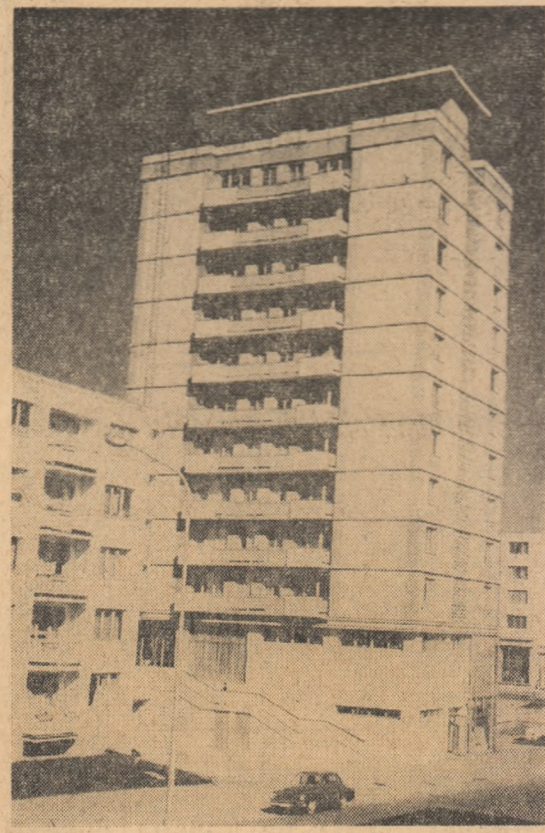
Din noul peisaj al orașului Suceava