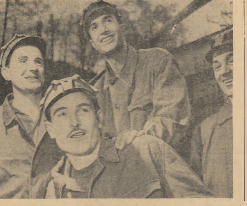
La întrecere cu canoalele brigada din sectorul I al minei Lupeni, brigada condusă de Iliu Julea au evinsat pe o distanță de 1000 m. În fața lor — în lăstivă din gît — haură roșie și albastru — creștea steagul revoluției.

ION GHEORGHE MAURER Președintele Consiliului de Miniștri al Republicii Populare Romine