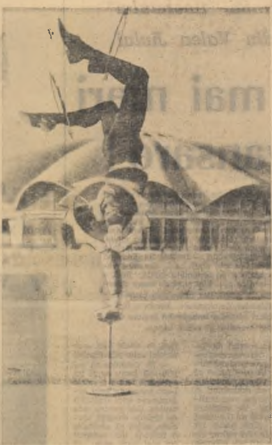
De data aceasta, nu sub cupola cerului ci în grădina... (Anul din componenții trupei Medrano, care evoluează la Circul de Stat)

— Nu este vorba de o „documentare“ propriu-zisă și intenționată ad-hoc, ci de trăirea efectivă, alături de eroul principal care aparține acestui mediu, el de fapt fiind, ca și fiecare muncitor al șantierei lui, primul autor al lucrării literare. Urmărind eroii îndrăgii, care ne stau la inimă, descoperim în mod normal medii întregi, o lume întreagă a șantierei, a uzinei în condiția lor zilnică, cotidiană. Materia vie a acestui roman este extrasă dintr-o experiență de șapte ani formată trăind alături de constructorii despre care scriu, iată de ce și repet că primii lui autori sînt acești oameni ai șantierei lui.