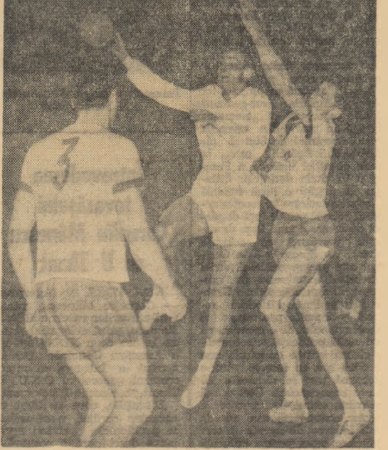
Fază din meciul de handbal dintre echipele Dinamo Buc. — Worwarst Berlin

Simbătă la amiază, noul ambasador al Italiei la București, Niccolò Moscati, a depus o coroană de flori la Monumentul Eroilor Patriei. Au fost de față reprezentanți ai Ministerului Afacerilor Externe, Ministerului For-