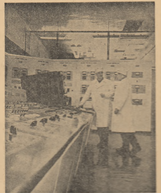
U.R.S.S. Aparat de la centralele atomice electrice de la Novovoronej