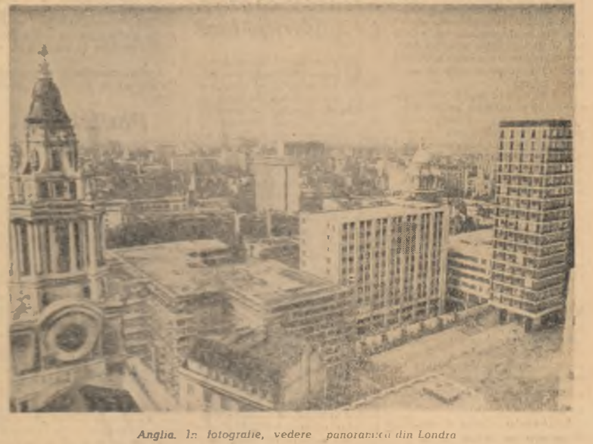
Anglia. În fotografie, vedere panoramică din Londra

Practic însă O.E.C.D. a preluat succesorul O.E.C.E. Abia în noiembrie 1961, la prima sesiune a Consiliului său ministerial. Scopul inițial al acestei organizații era aplicarea conceptului de „plan Marshall”, precum și efectuarea unor operațiuni comerciale și de pînă între statele membre. La mai tîrziu de un deceniu de la înființare, parternerii O.E.C.E. au constat că organizația lor rămînea practic fără obiect, „planul Marshall” fiind considerat ca o legătură cu trecutul și nu ca un instrument de pînă între statele membre. La 14 decembrie 1960 are loc la Paris o conferință în care participă cei 15 membri ai O.E.C.E., cit și Statele Unite și Canada. Conferința a hotărît încheierea unei convenții prin care Organizația europeană de colaborare economică (O.E.C.E.) este înlocuită cu Organizația pentru Colaborare Economică și Dezvoltare (O.E.C.D.).