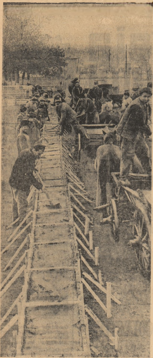
Lucrările în câmp s-au împușinat. Colectivii din comuna Ianco, raionul Făurei, s-au apucat de ridicarea unei noi construcții zootehnice. În foto: se toarnă fundația unui nou grajd de mare capacitate (200 de capete)