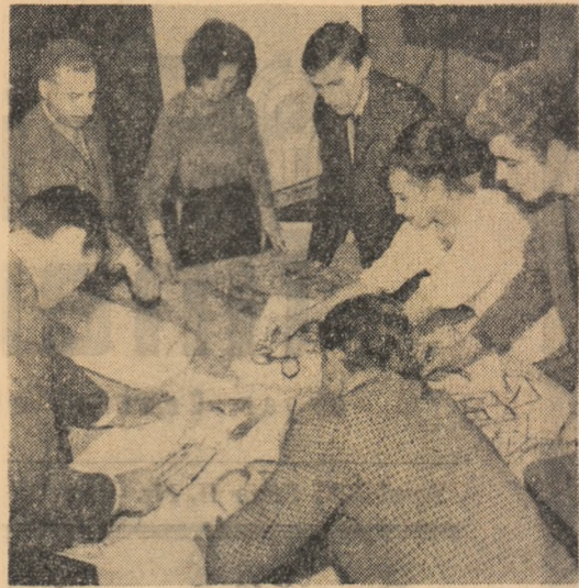
Se întocmește ediția specială „Ce-am văzut și ce-am aflat“