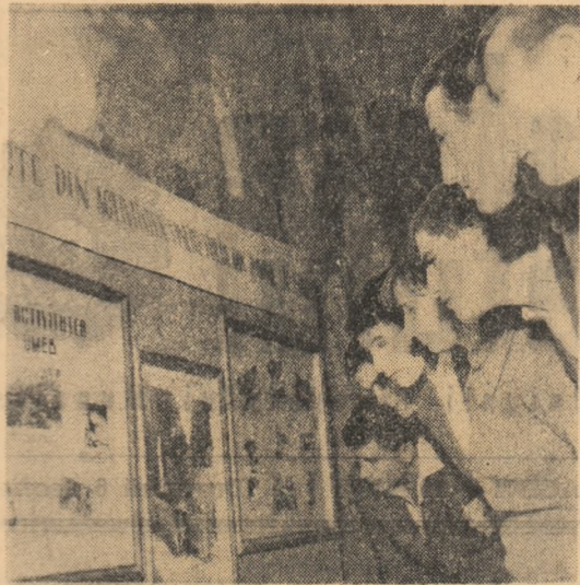
Popa la expoziția din hol: „Aspecte din activitatea tineretului din raionul 16 Februarie“