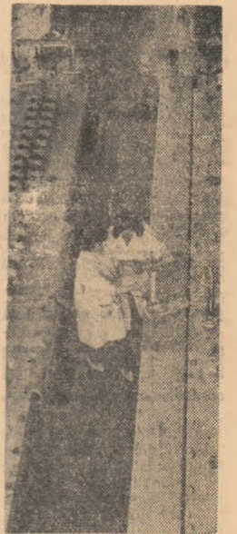
În secția de electroliză a Combinatului de celuloză și hîrtie din Brăila