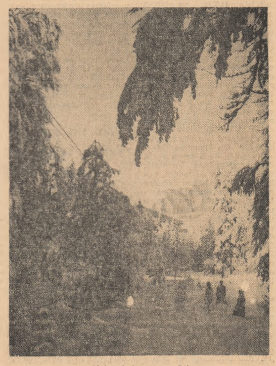
Pe Valea Iadului spre Dihan

Numeroase alte întreprinderi din întreaga țară au atins îndeplinirea planului anual. Uzina metalurgică „Ceahlău” din Piatra Neamț este a 20-a unitate din regiunea BACĂU care și-a îndeplinit până acum sarcinile prevăzute în 1964. Metalurgia de aici au produs în afara prevederilor pe aici 400 de generatoare de acțel, un mare număr de remorci-dormitor tip S.M.T. etc. În ultimele zile au mai realizat prevederile planului anual Salina Tg. Ocna, Antrepozițul frigorific și Întreprinderea de colectare și industrializare a laptelui Băcău, unități ale industriei locale, stații de mașini și tractoare și altele din această parte a țării.