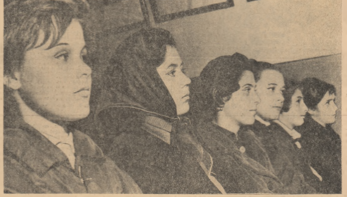
Tineri de 18 ani, la una din sărbătorile organizate în cinstea majoratului în orașul Blaj

Tovarășul ANTONIN NOVOTNY Prim-secretar al Comitetului Central al Partidului Comunist din Cehoslovacia, Președintele Republicii Socialiste Cehoslovace Praga Stimate tovarășe Novotny, Cu prilejul celei de-a 60 aniversări a zilei dumnezeoastră de naștere vă transmitem în numele Comitetului Central al Partidului Muncitoresc Român și al tuturor oamenilor muncii din Republica Populară Română un călduros salut tovarășesc și cele mai sincere felicitări.