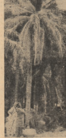
Imagine din Dahomey: Șosea mărginită de palmei

Greva foamei de 48 de ore declarată de trei lideri budista a provocat „proteste tot mai evidente exprimate față de guvernul Huong”. Oricum persoana cit de cit promisiunile de la Saigon, care are ca rezultat să-i susțină în mod public pe primul ministru Tran Van Huong, riscă să fie jinxat disprețului cercurilor largi, semnificativ agențiile de presă.