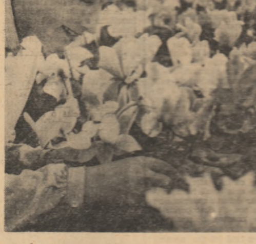
Ingrijind florile Ciclamen în serele din Codlea

Mari producții au fost obținute anul acesta și din celelalte sectoare, mai ales din cel legumicol, pentru care luncile rîului Bărbat oferă cele mai bune condiții de sol și irigație.