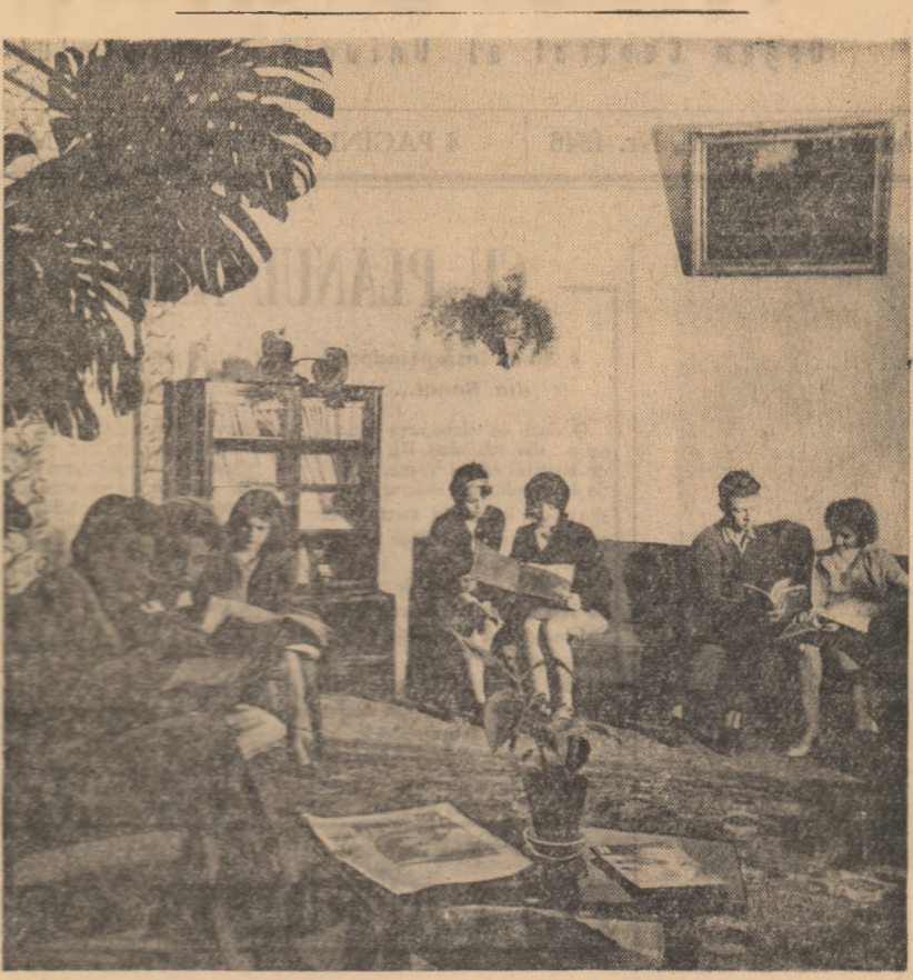
În sala de lectură a Casei de cultură a studenților din Brașov

În multe seri din iarna aceasta, colectivizții din comuna Girbovi, raionul Urziceni au ascultat interesante expunerii. Majoritatea conferințelor au fost expuse liber folosindu-se un bogat și variat material didactic, fiind actualizate și localitate la specificul comunei Girbovi, urmate de programe artistice prezentate de către formațiile artistice din comună sau de filme. A-