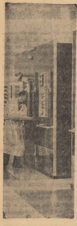
Acți se „nasco” pui. (Aspect dintr-o sală de incubatoare)