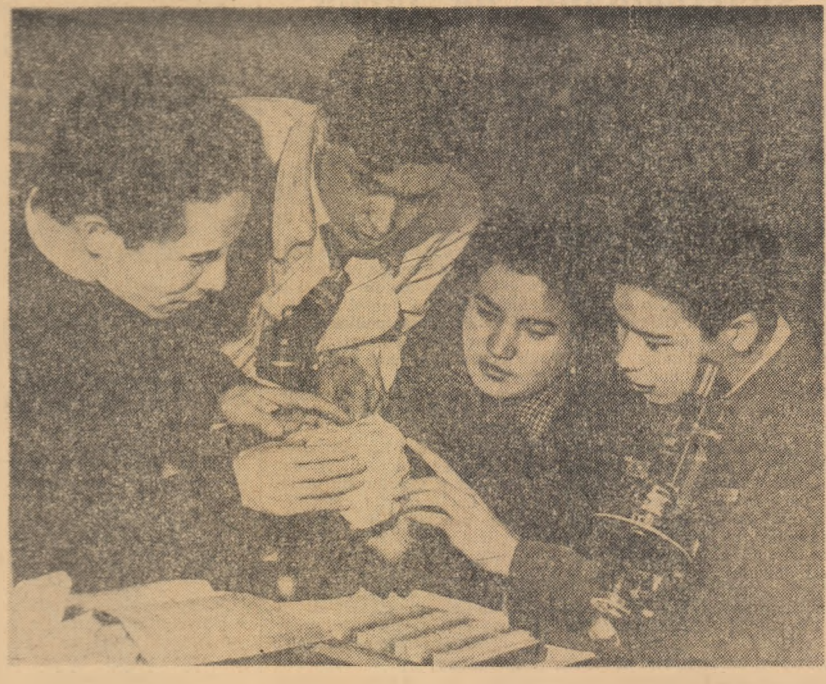
R. P. CHINEZĂ. Studenții ai Institutului de mine din Sinkiang (regiunea de nord-vest a Chinei) în timpul lucrărilor de laborator

În conformitate cu acordul încheiat între Consiliul de Ajutor Economic Reciproc și guvernul Iugoslaviei, la ședin-