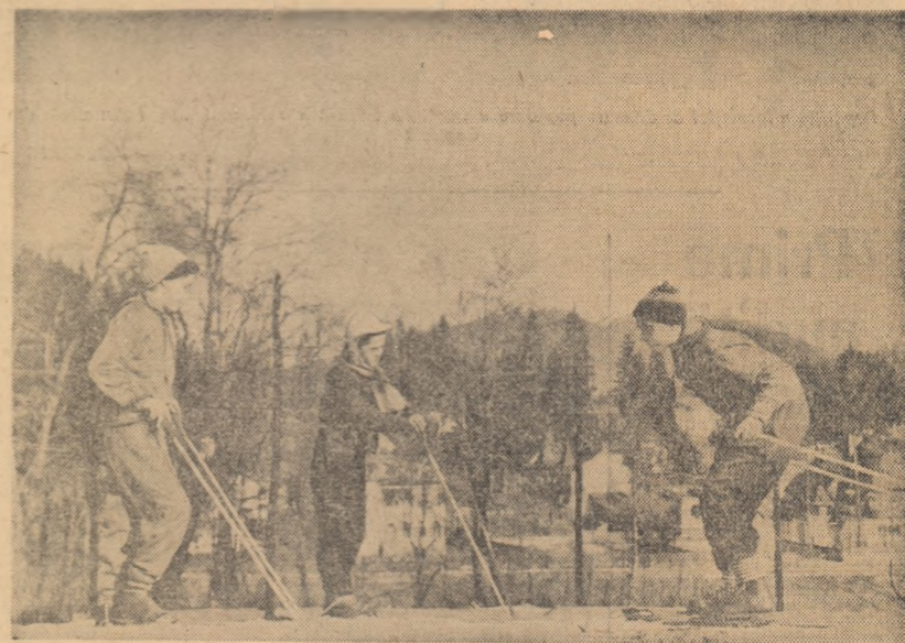
Prima lecție de achi