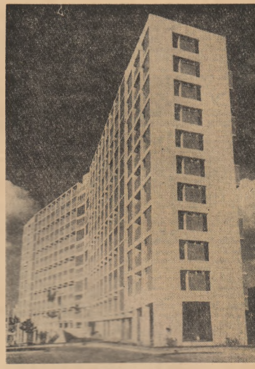
CUBA — Havana — În construcție în prezent este orașul

GUINEEA. — Muncitorii învâșd și-au minuscă stațiile de radio-transmisie și să facă reparațiile respective