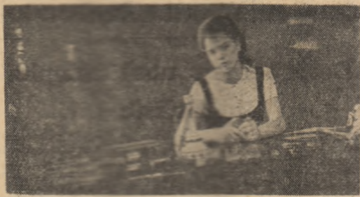
La patru pași de infinit