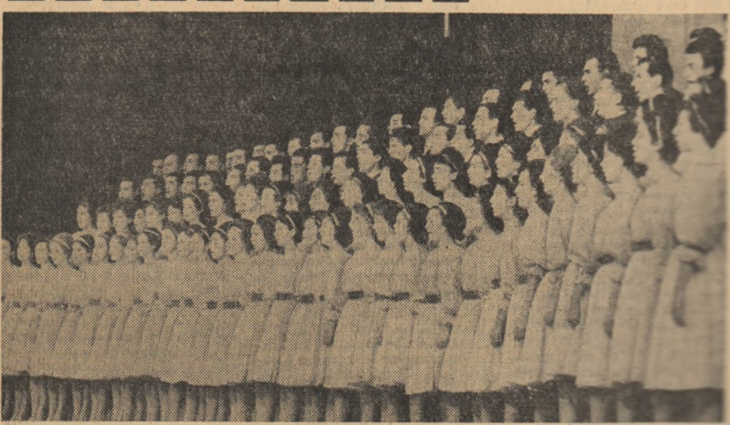
Aspect din spectacolul prezentat de Ansamblul artistic U.T.M. Citiți în pagina 3-a cronica spectacolului „TINEREȚE, ANI DE AUR”