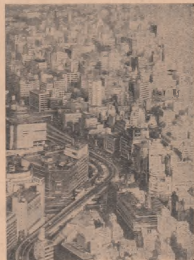
JAPONIA. Vedere parțială a cartierului Sukiyaoshi din Tokio. Acest cartier este centrul comercial al capitalei.

NEW YORK — Avocații lui Jack Ruby, condamnat la moarte la Dallas pentru uciderea lui Lee Oswald, asasinul președintelui Kennedy, au înaintat un recurs instanței superioare. Potrivit presei americane, Curtea de apel din Austin (Texas) va începe examinarea recursului în luna aprilie.