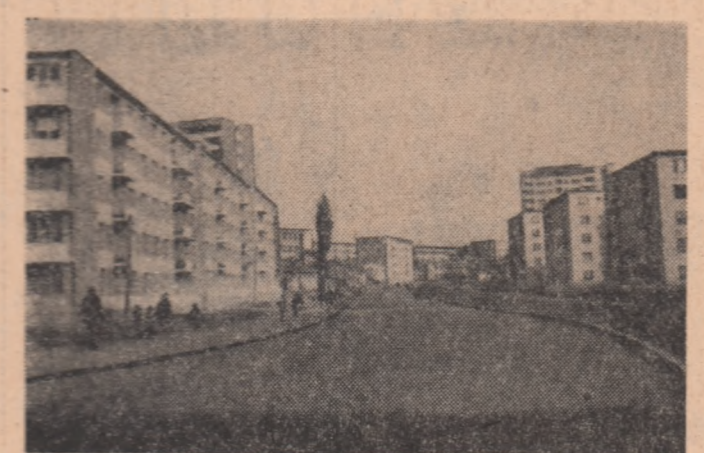
La Craiova, pe Calea Lenin s-au dat recent în folosință noi blocuri de locuințe

Acest lucru nu l-a făcut nici delegatul Buzei pentru desfi