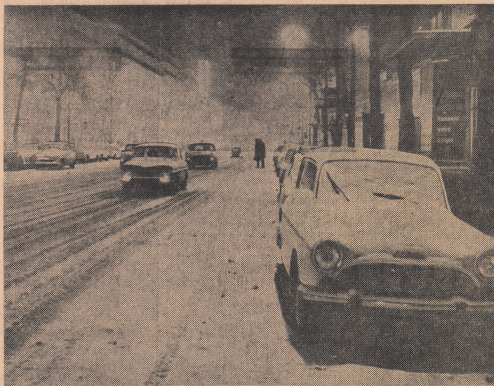
FRANȚA. La Paris, ca și în alte regiuni ale Franței, iarna este în toi.

În prezent, trezoreria Franței deține 3.500 tone de aur valorînd aproximativ 19 miliarde de franci, ceea ce reprezintă 20 de trenuri a câte 44 vagoane de 20 tone fiecare. Din această cantitate de aur numai o parte se află în seiful Băncii Franței, restul fiind depozitat la Băncile din Londra și S.U.A. Aurul francez din străinătate urmează însă să fie readus în țară în mod progresiv.