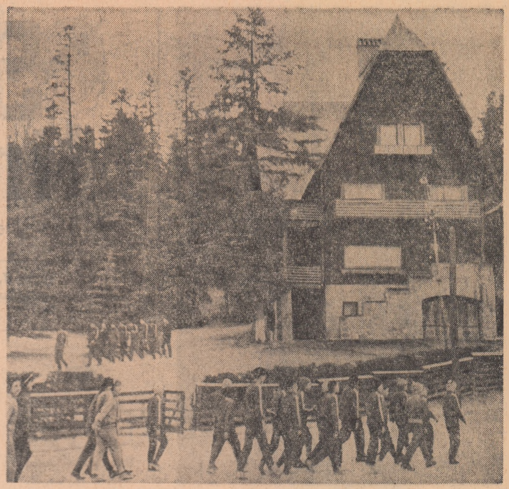
1400 de elevi au fost oaspeți — în această vacanță — al Sinaiei. În fotografie: un grup de elevi de la Școala sportivă nr. 2 din Capitală.