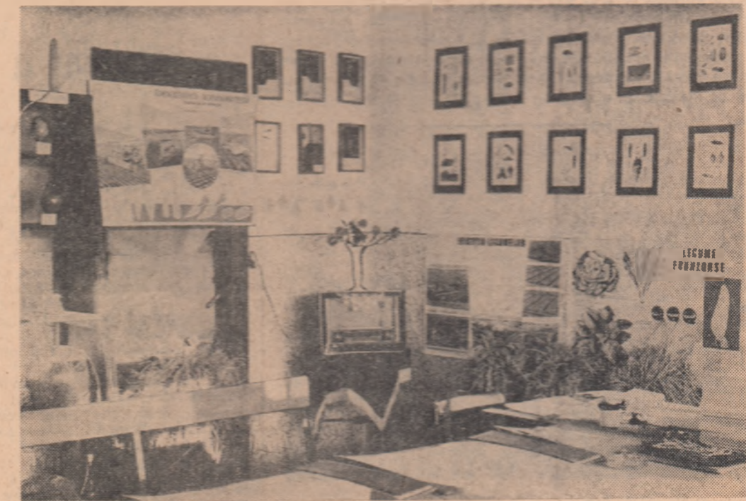
Interior al casei-laborator de la cooperativa agricolă de producție „Independen- ța”, raionul Galați

... Răspunsul la întrebare este acum cert. Cele mai bune și constante producții în condi- țiile de climă și sol de aici se obțin de la hibridii nr. 405 și