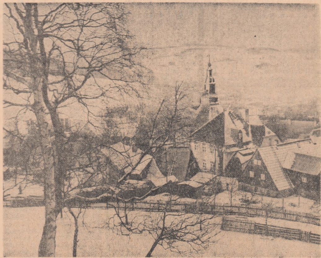
R. D. GERMANĂ: Un colț pitoresc din localitatea Seifen, districtul Gera, sub manta albă a primel zăpezi

CONAKRY — Ernesto Guevara, ministrul economiei Republicii Cuba, a sosit joi la Conakry în Guinea într-o vizită de o săptămîni. Într-o conferință radiodifuzată ministrul cubanez a vorbit despre necesitatea unei lupte împotriva imperialismului sub orice formă se manifestă acesta. El a declarat, totodată, că în acest spirit a întreprins călătoria pe care o desfășoară acum în Africa. „Delegația cubană condusă de Guevara, a vizitat pînă în prezent Algeria, Ghana, Mali și Congo (Brazzaville).”