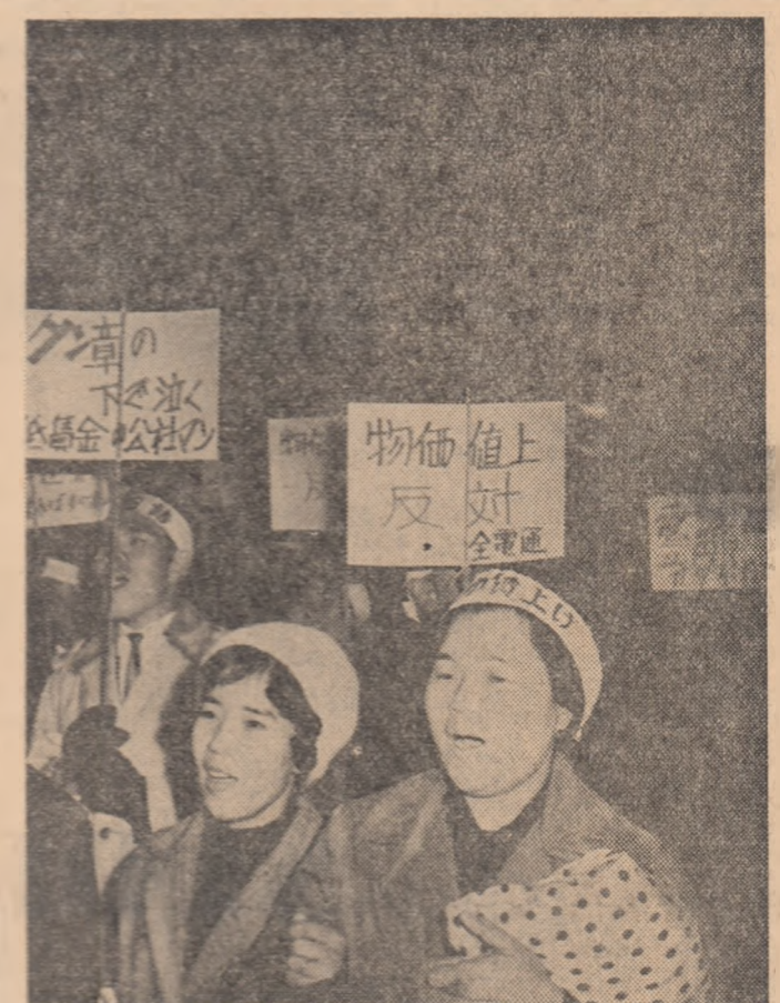
TOKIO: Aspect de la o demonstrație a muncitorilor din serviciile de utilitate publică în sprijinul revendicărilor privind majorarea salariilor