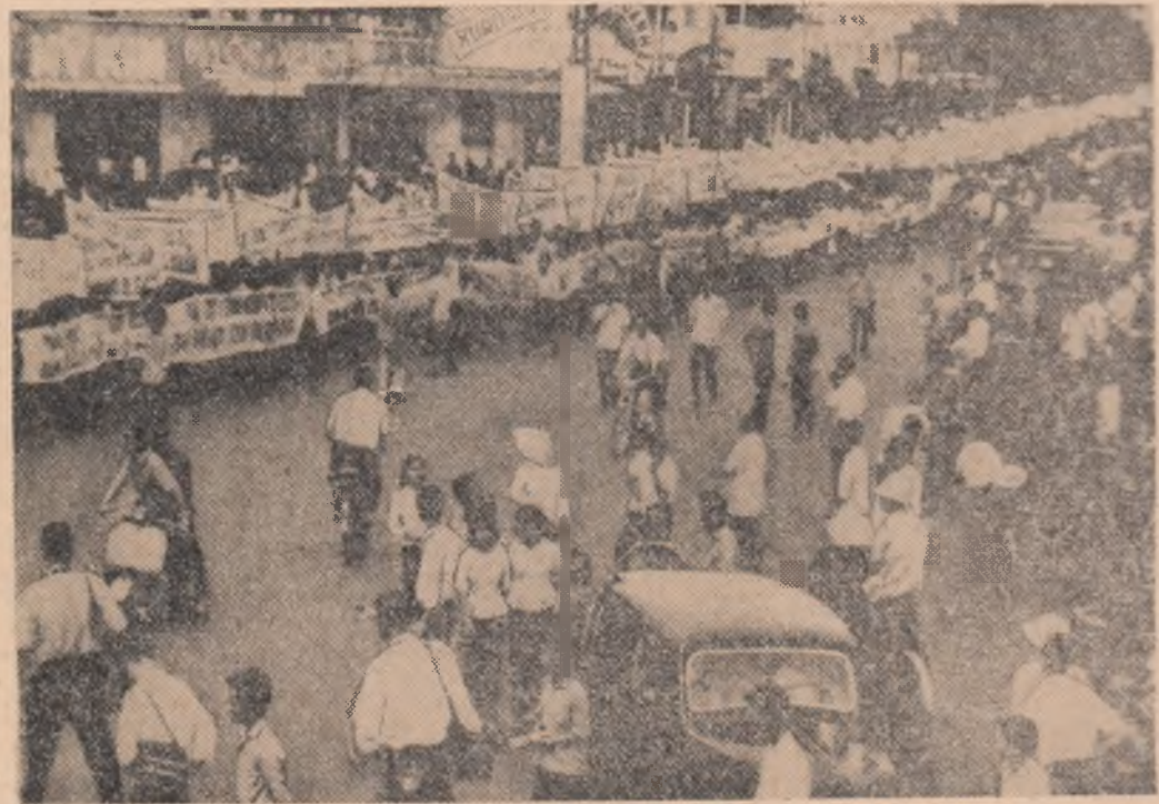
VIETNAMUL DE SUD: imagine de la una din ultimele demonstrații antiguvernamentale deslășurate la Saigon

O altă problemă controversată a fost aceea a alegerii viitorului secretar general al Commonwealth-ului. Printre posibilitățile ale căror nume au fost reținute pentru acest post se numără Arnold Smith (Canada), J. Desai (India) și Osman Ali Beg (Pakistan). Sarcina numirii secretarului general e recent, în ultima instanță, tot primilor miniștri din țările Commonwealth-ului, care urmează să se întrunească în cursul acestei sesiuni. Potrivit recomandărilor conferinței celor 20 de delegați din țările membre, cu această ocazie, vor fi numiți doi sau trei secretari adjuncți.