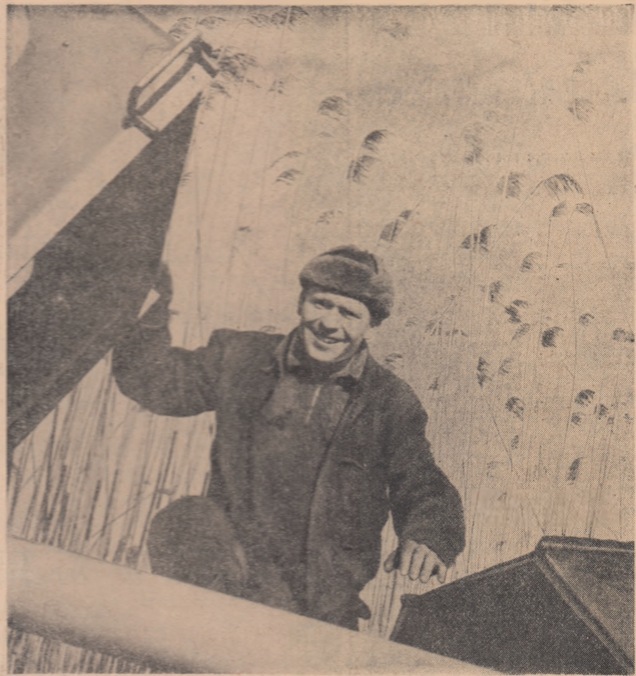
Munca este aspră, gerul este aspru — simțul încălzește, în locul soarelui, cerul acestor tineri nesfîrșite...

să-ți vină total de-a gata. La fărîșirea propriei tale personalități trebuie să pui serios s-măru și o poți face numai cunoștința-te bine, știind exact ce și cît poți face, dorînd să te autodepășești. Mi-amintesc că încă din liceu m-am interesat și m-am aștrus în mod special disciplinele legate de științele naturii. Fără îndoială că au contribuit la aceasta și profesorii pe care i-am avut: oameni personalități, ale căror lecții le sorbeam și care nu însoțeau în lungi plimbări pe cîmpuri,