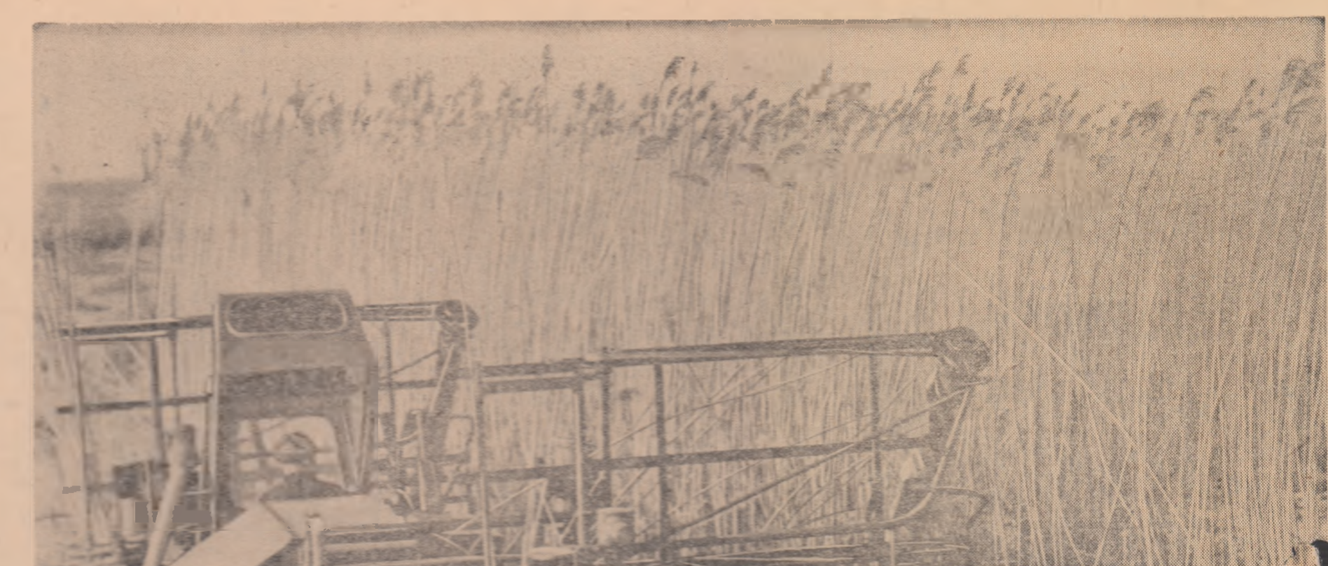
Seceriș la Coloana I — Sontea

și zilele Deltei, drumurile croite de ei