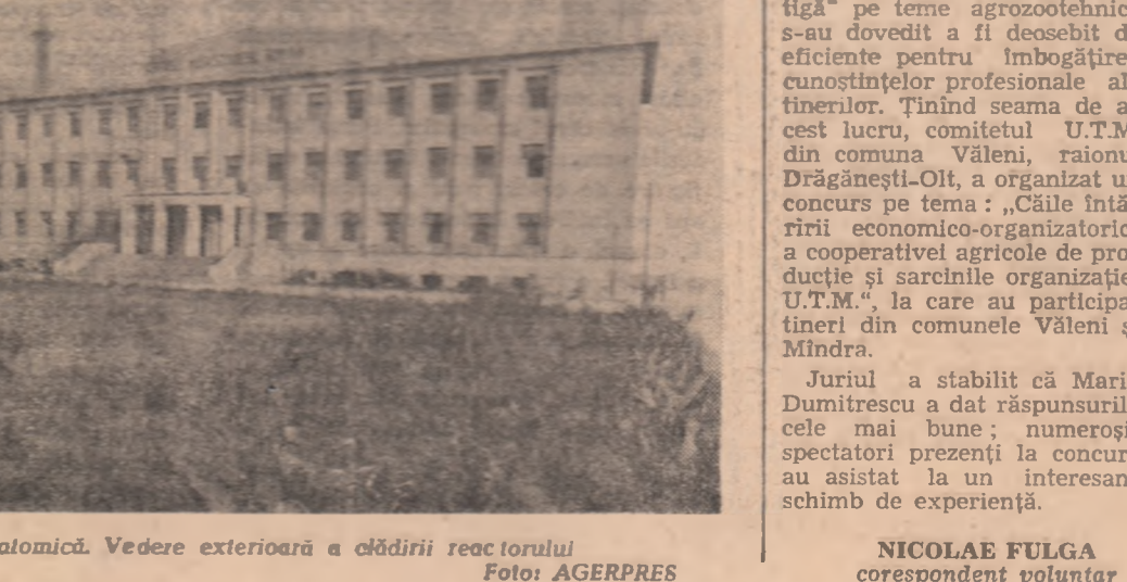
Institutul de fizică atomică. Vedere exterioră a clădirii reactorului

În timpul studiilor mele de învățământ la Liceul "Mihail Kogălniceanu" din Iași, am avut ocazia să cunosc pe un tânăr student care obținuse rezultate bune la examenul de admitere la facultate.