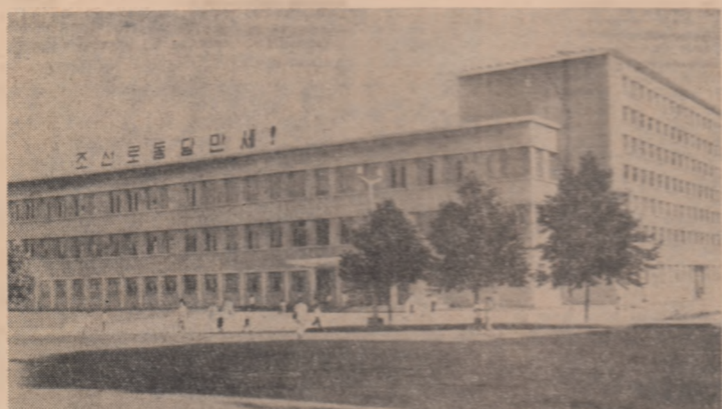
R. P. D. COREEANĂ: Biblioteca centrală din Phenian