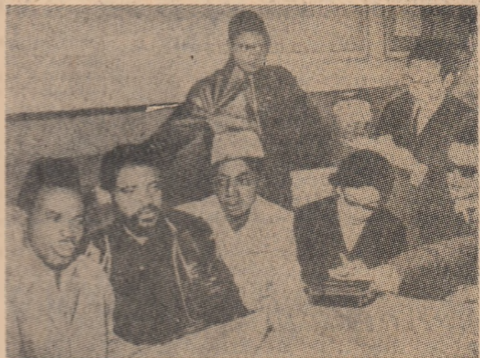
Unul din conducătorii forțelor patriotice congoleze, Gaston Soumialot, la o reuniune conferință de presă ținută la Cairo

Purtătorul de cuvînt al Ministerului Afacerilor Externe al Franței, Claude Lebel, vorbind de poziția guvernului francez față de participarea R. F. Germane la „planificarea nucleară” a NATO, a subliniat că „poziția guvernului francez este bine cunoscută”, dar Franța consideră că participarea R. F. Germane la planificarea nucleară „este perfect legitimă”.