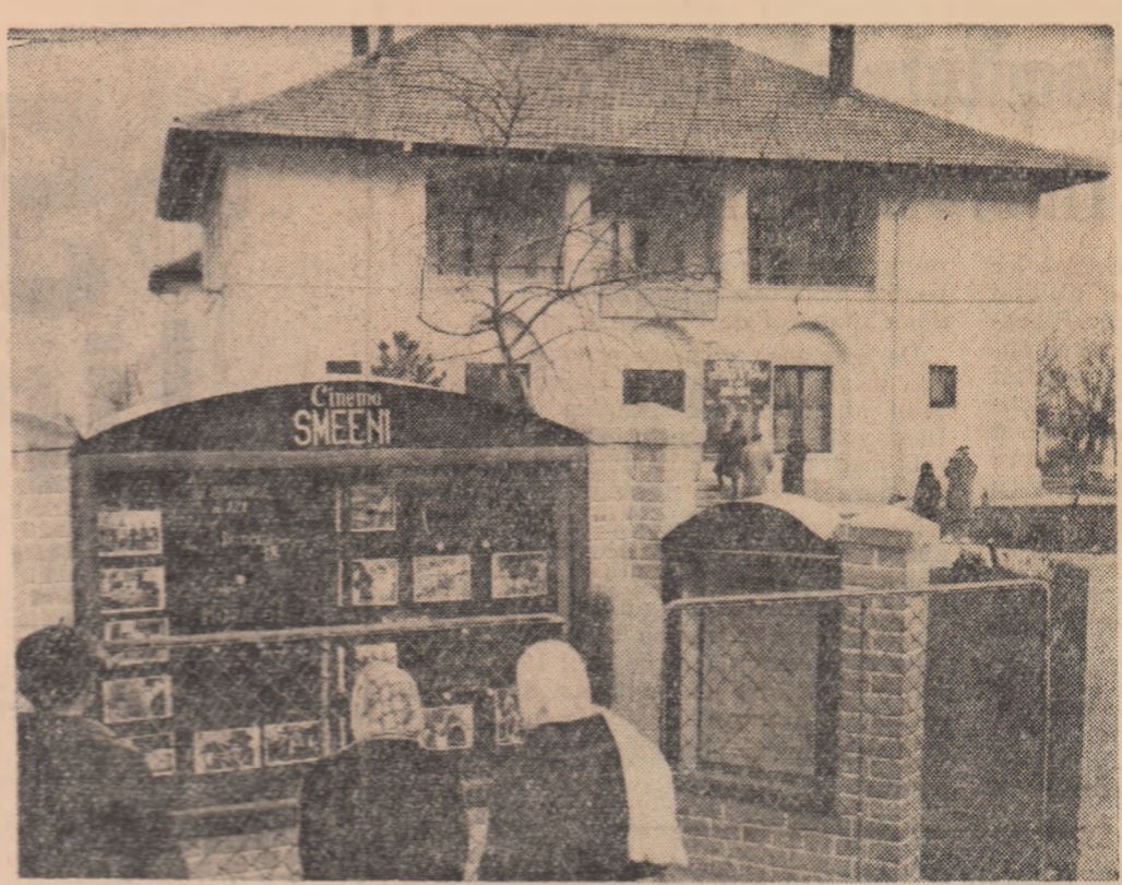
„Noutăți” anunțate sâtenilor de atelierul cinematografic al Comitetului cultural din Smeeni, raionul Burau, regiunea Ploiesti

„Să ne cunoaștem patria”, inaugurat cu simpozionul „Aci, în regiunea Crișana”, iar la Casa raională de cultură din Șimleu, un ciclu asemănător a fost deschis cu simpozionul „Monumente naturale și istorice din regiunea Crișana”. C. BEJAN