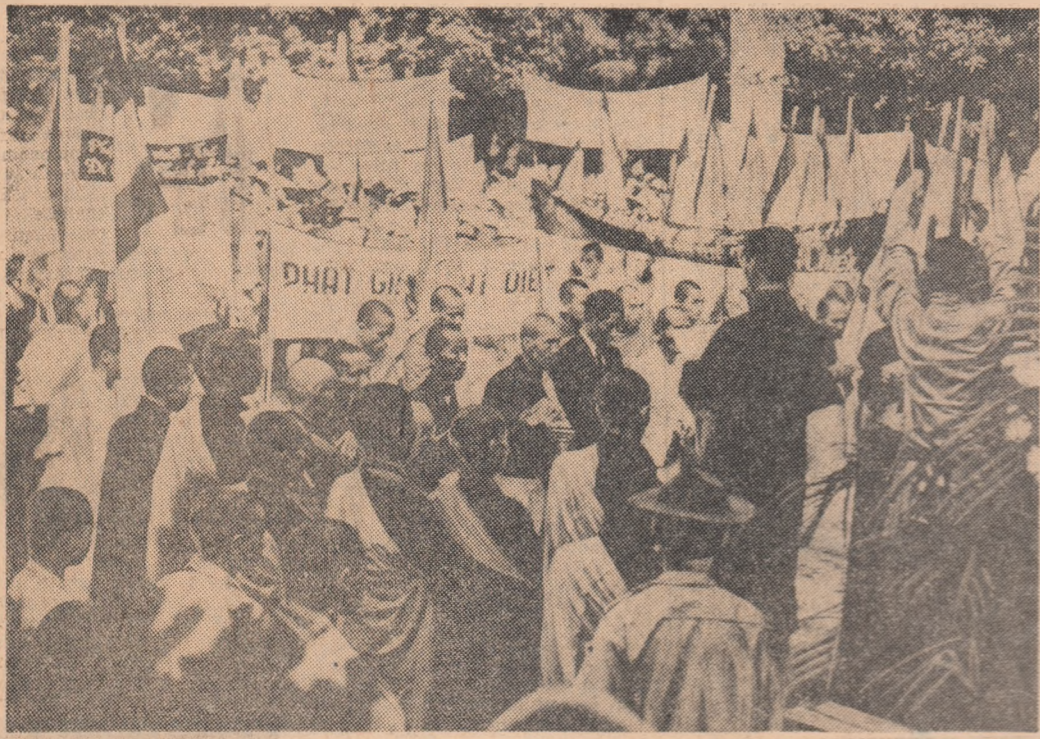
VIETNAMUL DE SUD: Aspect de la o demonstrație a bușilor din Saigon împotriva represaliilor polițienești