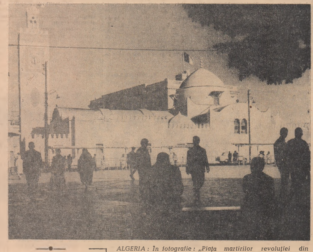
ALGERIA: În fotografie: „Piața martirilor revoluției din Alger”