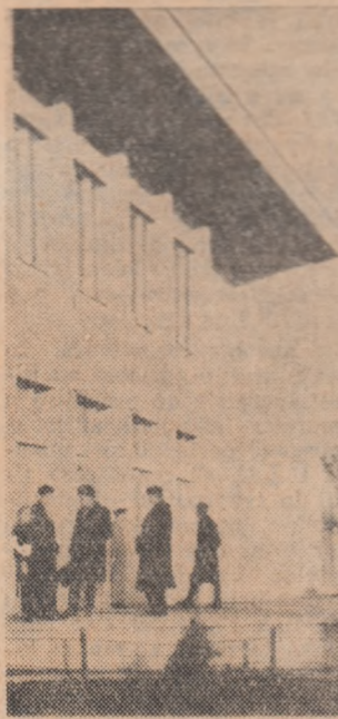
Blocuri noi de locuințe construite la Buhuși, alături de clubul Fabricii de postav din localitate

In marea hală a laminorului de 750 mm. de la Combinatul Siderurgic-Hunedoara