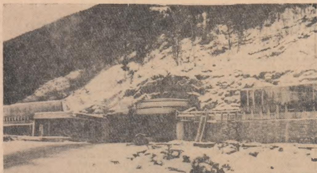
ELVETIA. Lucrările de construire a celui mai lung tunel din lume se apropie de sfîrșit. Acest tunel lung de 11,6 km, traversează Alpii chiar pe dedesubtul celui mai înalt munte al Europei, Mont Blanc, de 3 842 m înălțime. Noua cale denumită „Reute Blanche” va permite o comunicare directă între Paris și Roma. În fotografie: intrarea dinspre partea italiană a tunelului

În timp ce Franța, Olanda și Belgia s-au pronunțat pentru crearea unei piețe a zahărului pînă în 1967, R.F.G. și Italia s-au pronunțat pentru data de 1970.