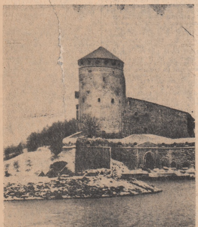
FINLANDA. În orașul Savonlinna, din sud-estul Finlandei, lângă apele lacului Sainaa, se află castelul Olavinlinna, construit în anul 1475, cel mai frumos castel medieval al Finlandei. În fotografie: vedere de exterior a Castelului Olavinlinna

Strălucitor a fost dus pînă la catedrala Waterloo și apoi, cu un tren special, în localitatea Bladon, unde a avut loc înmormîntarea în prezența membrilor familiei sale.