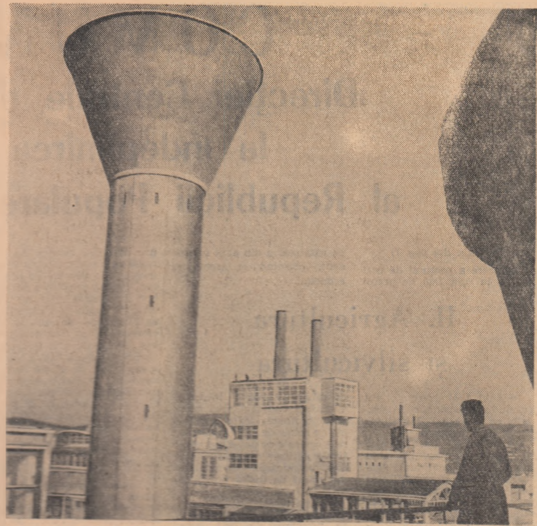
La Fabrica de geamuri Scăeni, prin intrarea în funcțiune a unor instalații și agregate noi, producția va fi în acest an cu 17 la sută mai mare decât în 1964. În fotografie: vedere parțială a fabricii

Citiți IN PAG A III-a ● Tinerii candidați ai F.D.P. ● Examenul confirmă munca din semestrul (Anul I la prima sesiune) ● „O poveste neînventată” (Cronica III-mul)