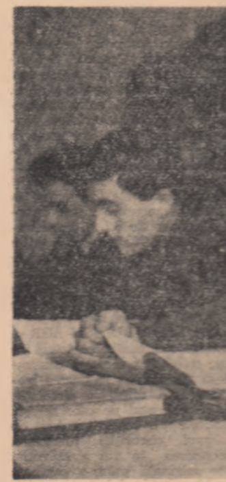
Aspect din sala de lectură a Bibliotecii Institutului politehnic din Cluj