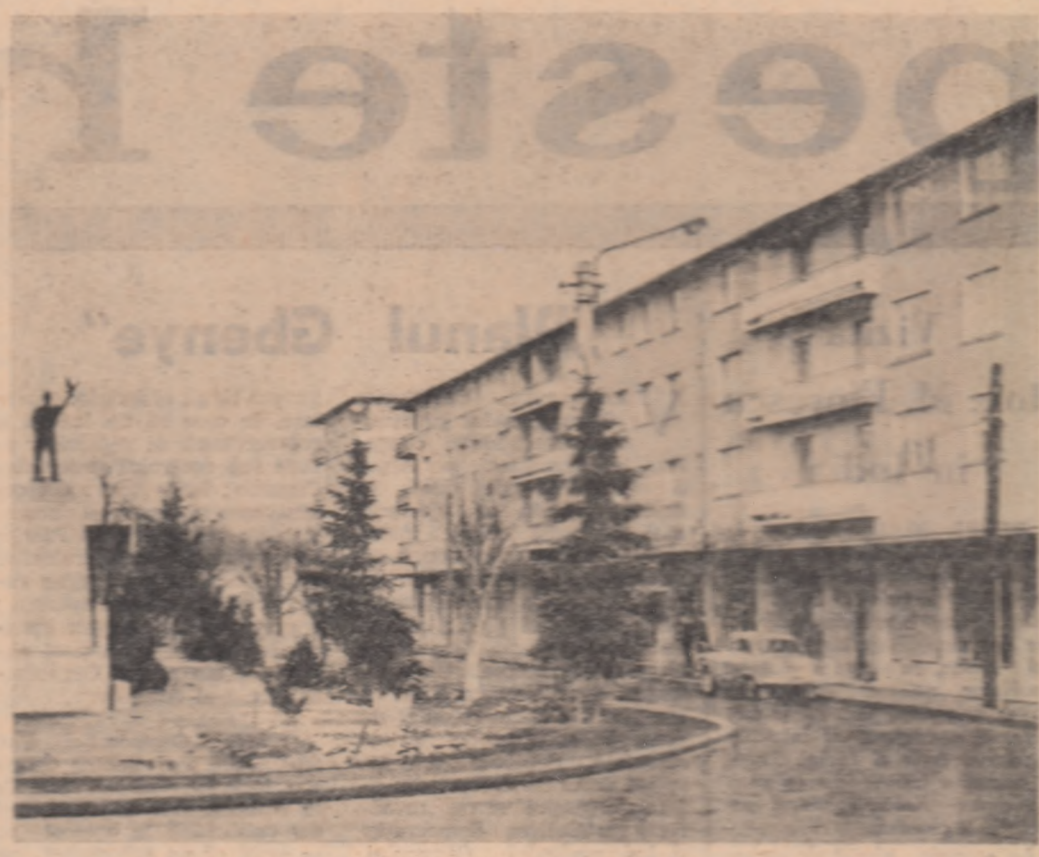
Noul blocuri de locuințe în orașul Simeria, regiunea Hunedoara