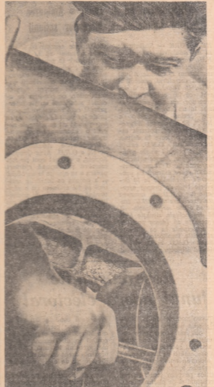
Fiecare operație e făcută cu siguranță și pricepere

Timpul pierdut a fost înalt recuperat. Pînă la 1 februarie au fost reparate și revizuite 73 de tractoare. Toate au trecut cu bine „examenul” în fața comitei de recepție și a mecanizatorilor care le au în primire. Productivitatea muncii a crescut de la 0,2 la 0,3. Dacă inițial a fost planificat să se repare 1,5 tractoare pe zi, s-a ajuns acum la 3 tractoare pe zi. Lucrîndu-se în acest ritm, încă înainte de 28 februarie tractoarele vor ajunge în timp, la brigăzi. O dată cu ele, mecanizatorii vor duce și piesele necesare pentru unele din mașinile care vor fi folosite în campania de primăvară.