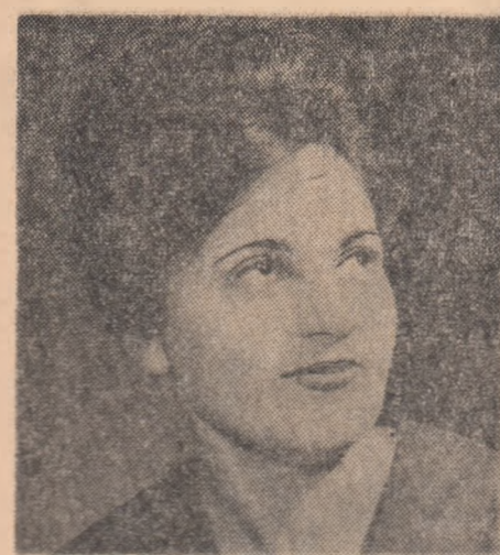
scriptia electorală nr. 98 în alegerile de deputați în Sfatul Popular al Capitalei a fost primită cu multă bucurie de către alegătorii din această circumscricție. Un semn al prețuirii, al încrederii pe care tovarășii de muncă, cetățenii din circumscricție îi acordă acestei tinere muncitoare.