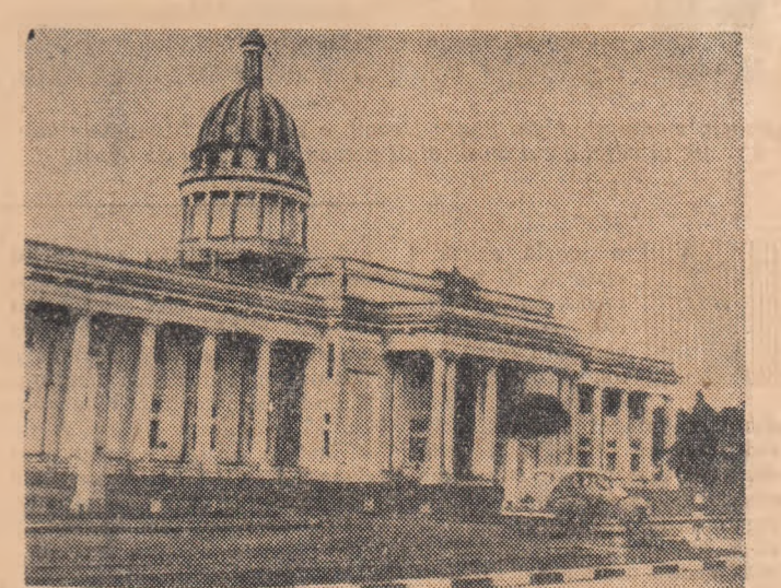
Imagine a clădirii municipiului din Colombo, capitala Ceylonului

Politica de îngrijire a activității monopolurilor străine în țară, naționalizarea depozitelor de produse petrolifere și a centrelor de desfacere a acestor produse, naționalizarea societăților de asigurări, limitarea importului de mărfuri industriale și creșterea sectorului de stat al economiei au constituit pași însemnați pe calea consolidării independenței. În domeniul relațiilor externe, guvernul ceylonez promovează o politică de pace, de renunțare la blocurile militare, de prietenie și colaborare pașnică cu toate