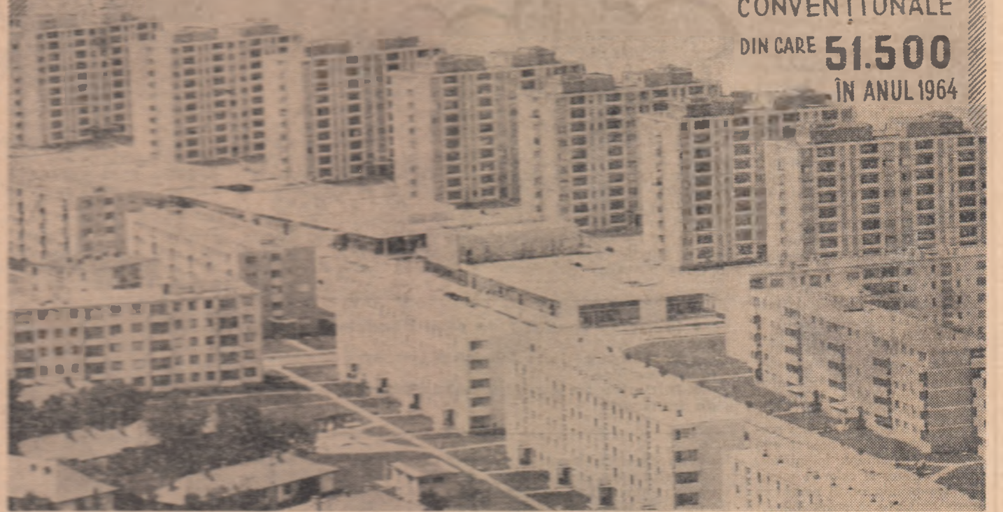
Potrivit buletinelui anual publicat în 1964 de Comisia economică pentru Europa a O.N.U., Republica Populară Română deține primul loc pe continent alături de ritm mediu general de creștere a construcțiilor de locuințe, și ca ritm calculat la 1 000 de locuitori.

CIRCA 214.000 APARTAMENTE CONVENȚIONALE DIN CARE 51.500 ÎN ANUL 1964