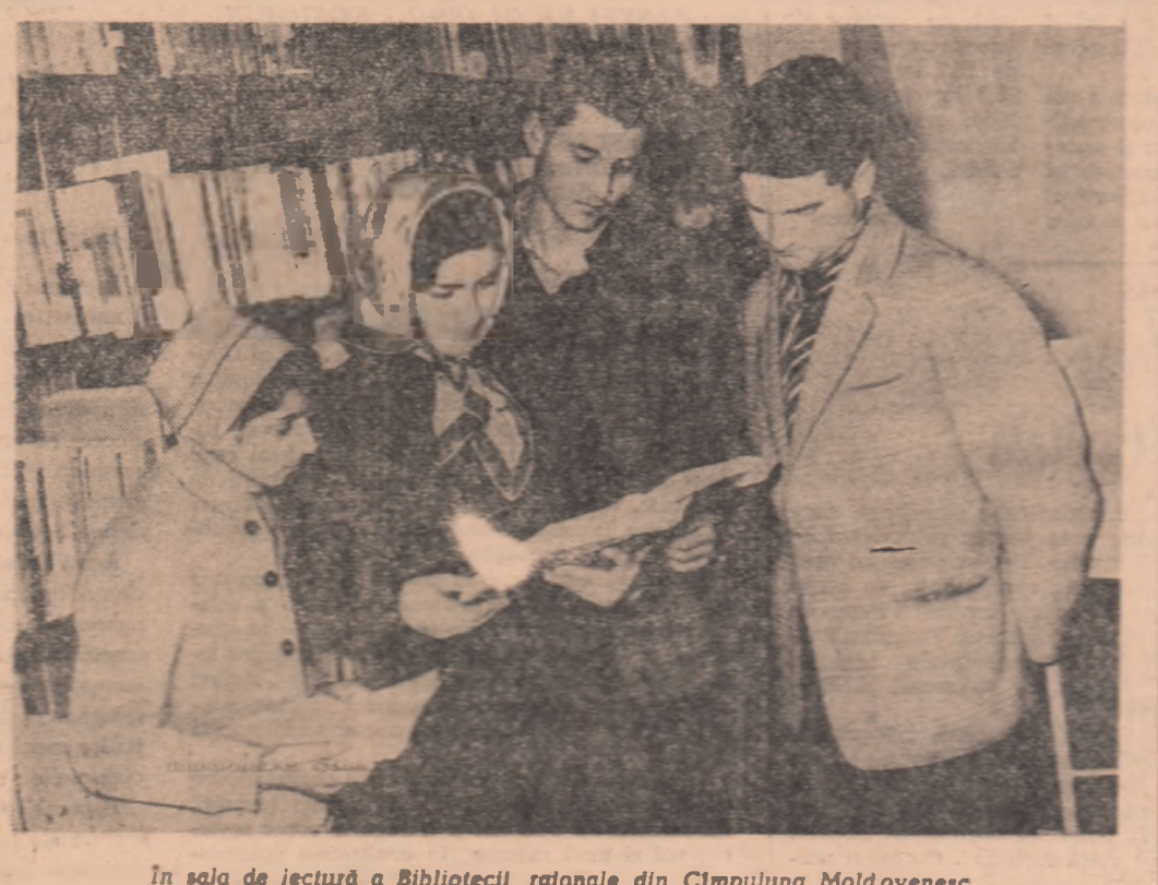
În sala de lectură a Bibliotecii raionale din Cîmpulung Moldovenesc