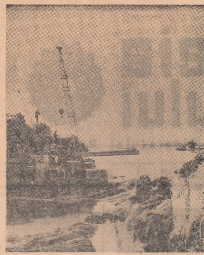
Imagine de la Unitatea de exploatare a stufului din Rusca