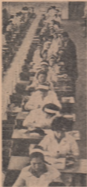
Întreprinderea „Progresul” din Capitală produce zilnic circa 8.500 perechi de încălțăminte. Recent, aici a intrat în producție o nouă linie tehnologică semiautomată cu o capacitate de producție proiectată de 1.000 perechi în 8 ore. În fotografie: vedere parțială a noului linii tehnologice

Pentru asigurarea îndeplinirii sarcinilor de plan și a angajamentelor luate în întrecerea socialistă a fost stabilit un plan de măsuri tehnico-organizatorice.