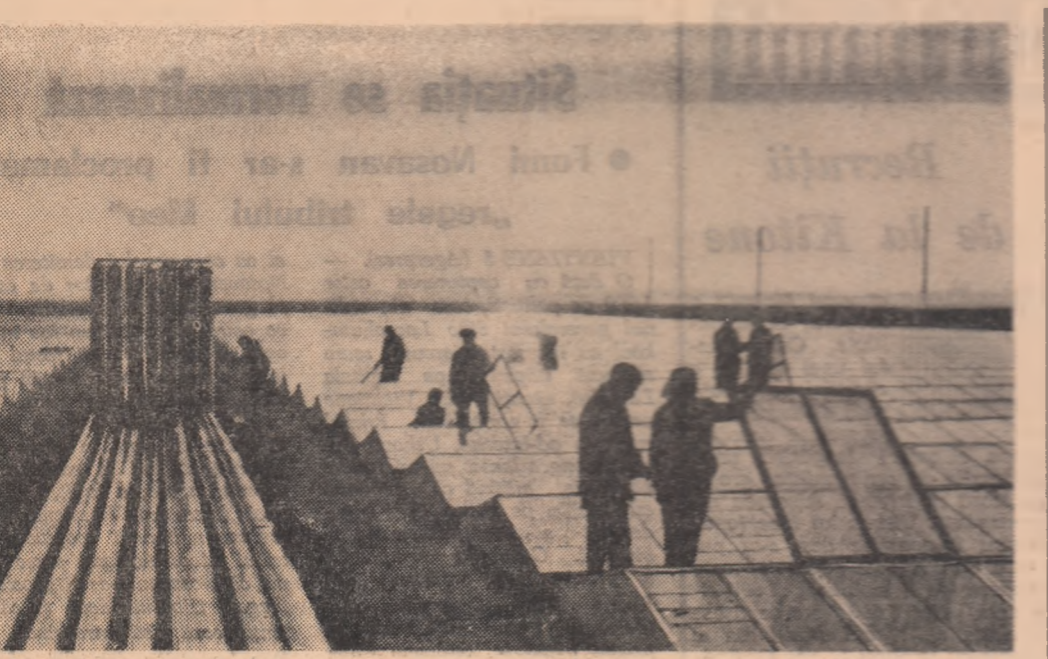
La G.A.S. Sabaru — București s-au construit 30.000 mp răsădnie cu încălzire biologică. Prin acest sistem se economisesc 10.000 tone de îngrășăminte naturale față de tipurile obișnuite cu încălzire biologică.

CONSTANȚA — La Măcin, Babadag, Negru-Vodă, Băneasa și în celelalte regiunile de raion au fost organizate expoziții cu vințare, iar în toate comunele și satele s-au deschis standuri și vitrine cu cărți de literatură beletristică, politică, agricolă și de știință. Unitățile cooperative de consum din regiune au fost aprovizionate cu cărți în valoare de peste 350.000 lei. La cîm-piunile culturale, la casele aleatorului, în școli, la biblioteci și la cluburi se sînt sezoaneli literare cu teme „Succesele oamenilor muncii din patria noastră ogîndite în literatură”, „Din cărțile scriitorilor prețioși”, „Cartea care mi-a plăcut” și discuții cu cooperatorii agricoli pe teme „Cum m-au ajutat cărțile agrotehnice în obținerea unor producții bogate”.