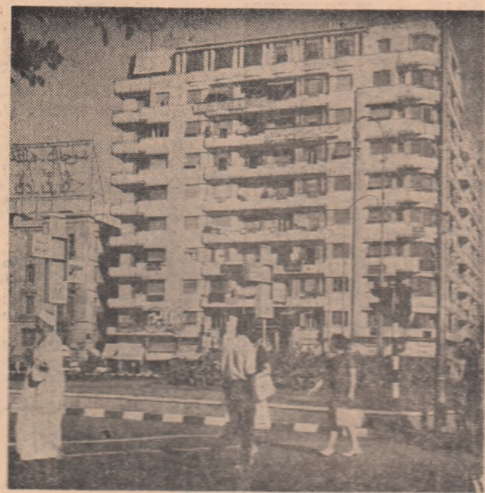
REPUBLICA ARABĂ UNITĂ — Fotografia noastră înfățișează un aspect din centrul orașului Cairo

În cuvîntarea rostită cu acest prilej, ambasadorul R. P. Romine a subliniat că poporul și guvernul român urmăresc cu sinceră bucurie realizările obți-