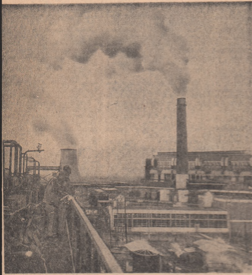
Pe șantierul Combinatului petrochimic Ploiești