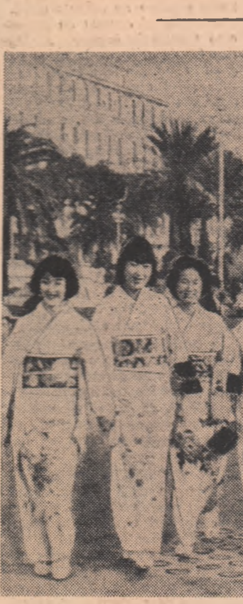
În urmă cu cîțva timp, un grup de tinere japoneze a venit în Franța pentru a învăța profesia de stewardesă. Iată-le în fotografie, pe străzile orașului Nisa