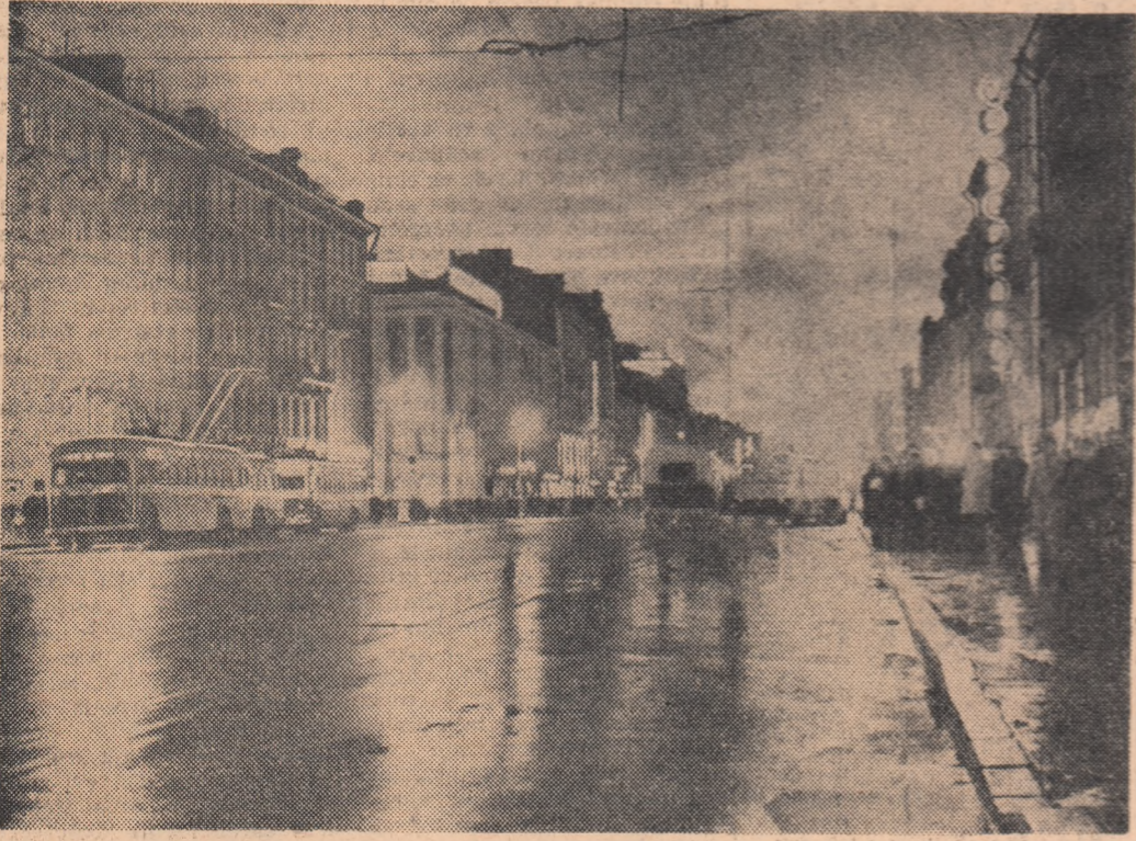
U.R.S.S. Seara pe unul din marile bulevarde ale orașului Leningrad