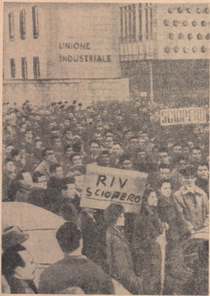
ITALIA. Tinerii muncitorii din Torino, manifestînd pe străzile orașului, în sprijinul revendicărilor lor