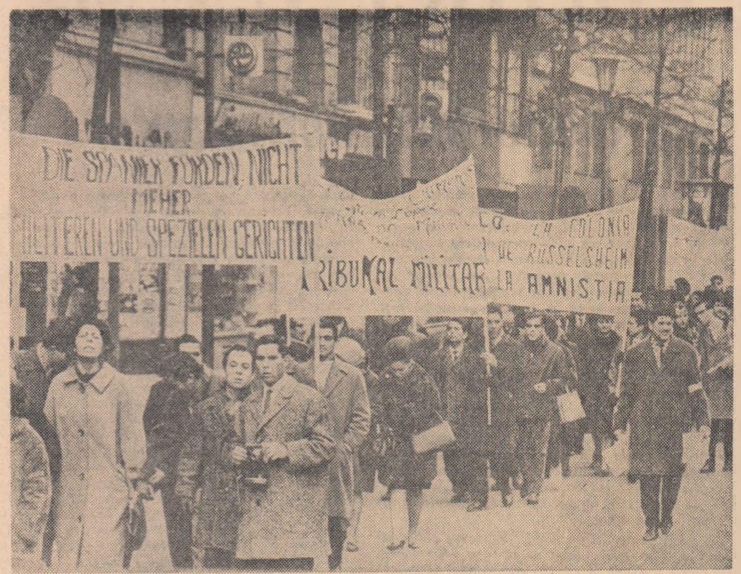
R. F. GERMANĂ. — Muncitorii spanioli care lucrează în Intreprinderile din Frankfurt pe Main au organizat un marș al tăcerii, în semn de solidaritate cu compatrioții lor. Ei cer eliberarea deținuturilor politice din Spania, dreptul la grevă pentru muncitorii spanioli, democratizarea vieții publice

Sosirea la Seul a ministrului de externe japonez a prilejuit de asemenea, puternice manifestații de protest. Un mare număr de studenți au postat în fața hotelului unde se află reședința lui Shina pancarte cu inscripții împotriva tratatelor japono-sud-coreene. Se așteaptă ca partidele de opoziție să organizeze noi manifestații împotriva tratatelor, revendicând despăgubiri din partea Japoniei pentru pierderile suportate în timpul celui de-al doilea război mondial.