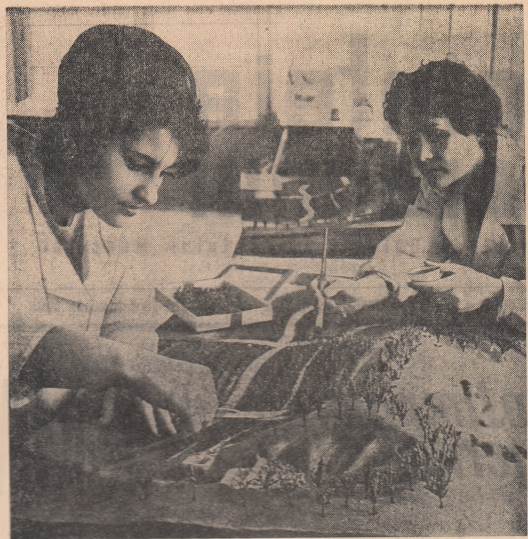
Centrul de material didactic și propagandă agricolă. Se lucrează la macheta care ilustrează amenajarea terenurilor în pană prin plantări pomiviciole

„Îndeplinirea sarcinilor de plan în mod ritmic și fără pierderi se realizează în primul rînd pe baza respectării disciplinei muncii. Prin respectarea disciplinei nu trebuie înțelese numai lichidarea absențelor nemotivate, a întîrzierilor, folosirea întrega-