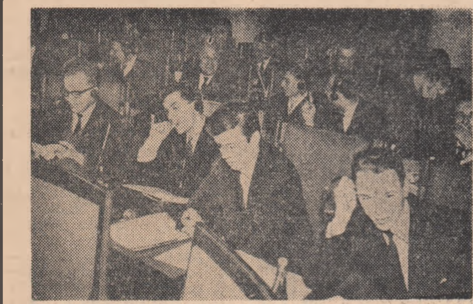
În timpul întâlnirii de la Varșovia

probleme de interes comun între organizații studențești reprezentând studenți cu concepții politice, filozofice și religioase diferite. U.A.S.R. a participat activ la toate întâlnirile care au avut loc până în prezent, conștient fiind că stabilirea de contacte și apropierea între uniunile naționale studențești europene, de diferite orientări politico-filozofice, indiferent de afilierea lor internațională, constituie un factor important în dezvoltarea cooperării și făurirea unității de acțiune în mișcarea mondială studențească, condiție hotărâtoare în asigurarea succesului deplin al luptei comune pentru înlăturarea intereselor și aspirațiilor legitime ale tineretului universitar de pretutindeni.