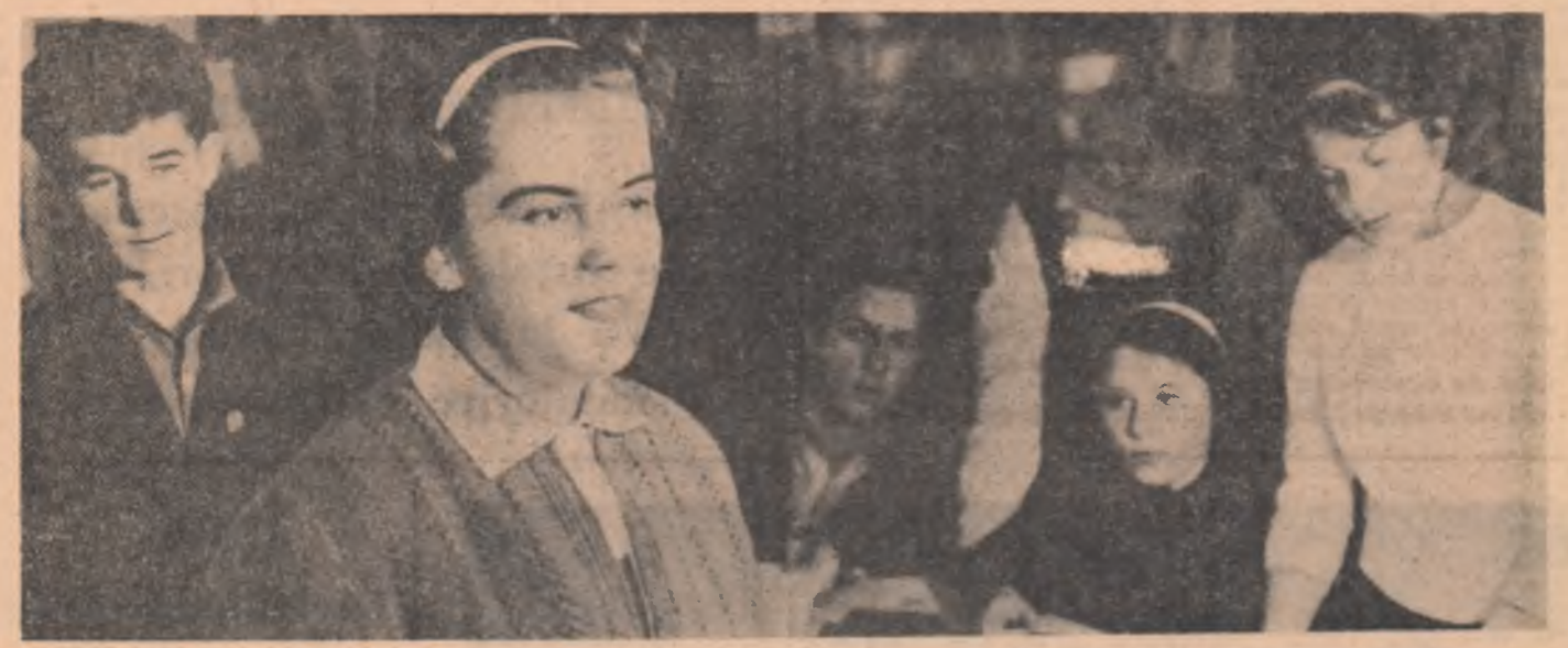
Ședință de lucru a cercului literar de la Școala medie nr. 3 — Turnu Severin

florirea comunei continuă cu aceeași pasi repezi și mari. În prezent se lucrează la construirea unui magazin universal, la recordarea rețelei electrice, la sistemul energetic național etc. Pentru toate acestea, pentru viitorul nostru imi voi da votul la 7 martie.