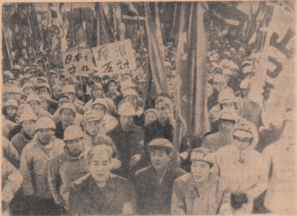
JAPONIA. Aspecte de la demonstrația populară a orașului Sasebo împotriva staționării submarinului nuclear american „Dragonul măritii”

Analizînd cifrele noului buget militar, toate zările londoneze sînt de acord că cheltuielile militare nu au fost cîtuși de puțin