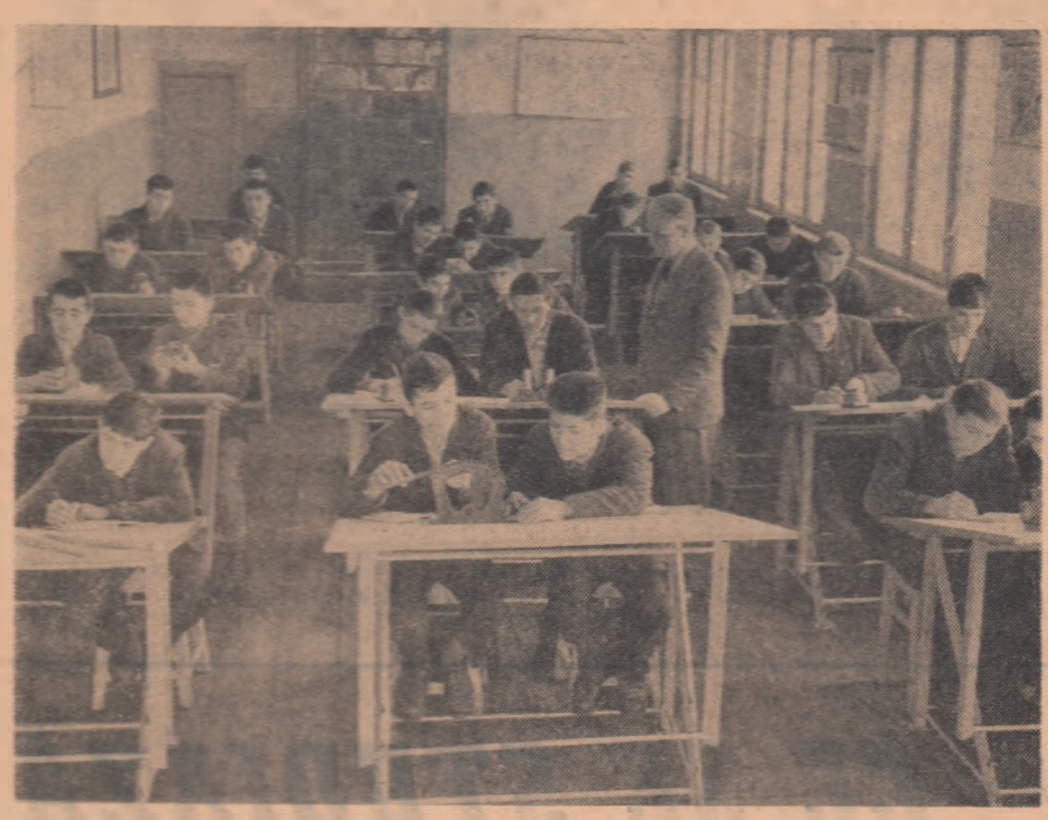
Pentru un viitor muncitor, desenul tehnic este o disciplină importantă. Iată de ce elevii anului II E strungă metalici de la Școala profesională de pe lângă Uzinele metalurgice „Sesăndtoarea” din Capitală — pe care-i vedeți în fotografie — acordă o atenție deosebită acestei discipline