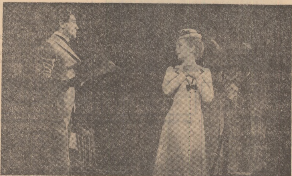
Teatrul „C. I. Nottara” prezintă în premieră „Colombe” de Jean Anouilh