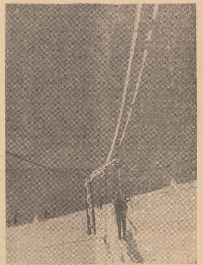
Cu schi-liftul, spre Virturile Muntelui Mic

19, 20,45). A.H. EVA I rulează la Munca (orele: 10,30, 14,30, 16,30, 18,30, 20,30). CEL MAI MARE SPECTACOL rulează la Mosilor (orele: 10,30, 14,30, 17,30, 20,30). NEVASTA NR. 13 rulează la Aurora (orele: 9, 11,15, 13,30, 16, 18,30, 21). Doina (orele: 11,15, 13,30, 16, 18,30, 20,45). CU MÎNILE PE ORAȘ rulează la Cosmos (orele: 16, 18, 20). VREMEA PĂGINILOR rulează la Vitorul (orele: 15,30, 18, 20,30). LA PATRU PAȘI DE INFINIT rulează la Colentina (orele: 16, 18,15, 20,30). SĂRUTUL rulează la Rahova (orele: 16, 18,15, 20,30). Ferentari (orele: 16, 18, 20). CAPITANUL FRACASSE — cinemașcop — rulează la Progresul (orele: 11,30, 14, 16,15, 18,30, 20,45). MICUL PESCAR — cinemașcop — rulează la Flamura (orele: 10, 12, 16, 18, 20,15). CARTOUCHE — cinemașcop — rulează la Drumul Sării (orele: 11,15, 17,30, 20). GHINIO-NISTUL rulează la Cotroceni (orele: 15, 17, 19, 21). CIND COMEDIA ERA REGE rulează la Carpati (orele: 10, 12, 14, 16).