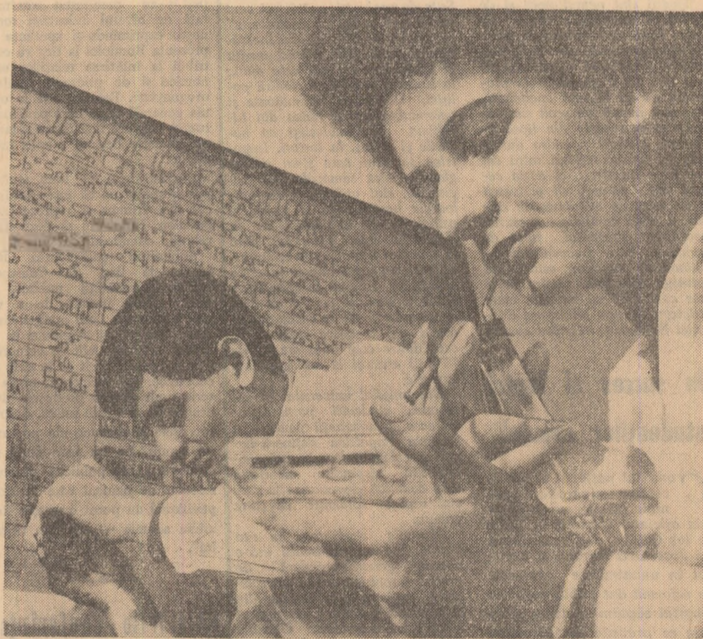
La Facultatea de Chimie a Universității din București — în timpul unei lucrări practice de laborator