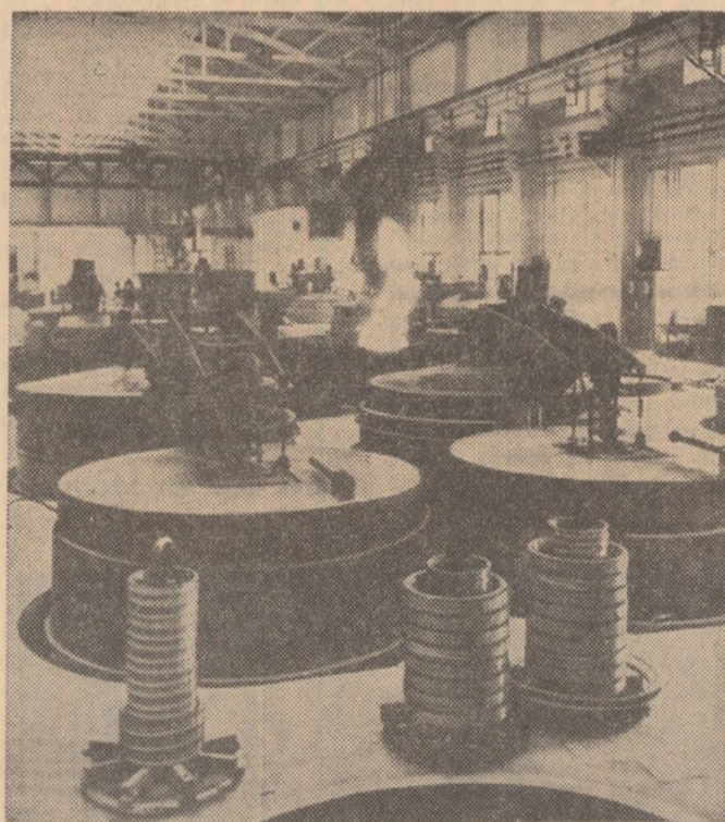
R. P. CHINEZĂ: Aspect dintr-o nouă secție de fabricare a lagăre de mari dimensiuni la uzina Loyang

vederea reducerii încordării și menținerii păcii în Vietnam. Raportul special, semnat de delegații Indiei și R. P. Polone, este însoțit de o declarație a delegatului Canadei, care susține poziția S.U.A. nu a semnat documentul. Raportul este, de asemenea, însoțit de declarații ale delegaților indieni și polonezi, care își exprimă dezacordul față de poziția delegatului canadian. Ministrul Afacerilor Externe al R. D. Vietnam a dat la 9 martie publicității o declarație prin care declară ilegal documentul canadian.