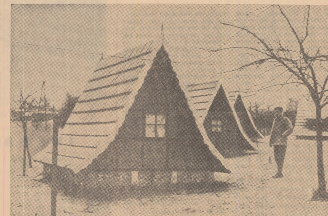
R. P. POLONĂ: Vile turistice tip „suprema” construite din carton de fibre, deșeuri de chereștea și lămate

CAIRO — Întreaga presă arabă comentează diferendul ivit între guvernul vest-german și cel al R.A.U. Conflictul pare să fi atins un punct culminant în momentul cînd Bonn-ul a anunțat intenția de a stabili relații diplomatice cu Israelul după ce mai înainte a hotărît să suspende creditele pentru dezvoltarea economică acordate R.A.U. După cum relatează ziarul „Al Massa” la cerea R.A.U. marja a avut loc o întrunire a reprezentanților șefilor state-urilor arabe pentru a analiza situația. La rîndul său, guvernul irakian a cerut ca simbioză să fie convocată o sesiune extraordinară a primilor miniștri arabi. Ministrul irakian al afacerilor externe a decla-