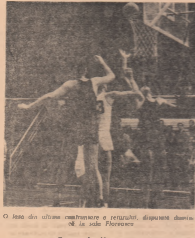
O lăcăș din ultima confruntare a returului, disputată duminică la sala Florescu