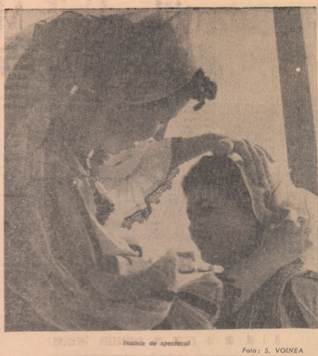
Înainte de spectacol