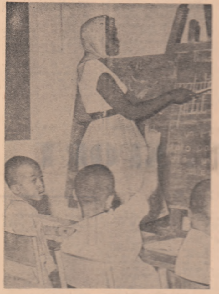
Primele noțiuni la o școală din Republica Mali

Încheiere, articolul din revista mai sus amintită relevă că învățămîntul superior malian a fost și el orientat spre a face față necesităților de cadre tehnice. În vederea realizării acestui obiectiv, au fost create cîteva institute specializate pe ramuri.