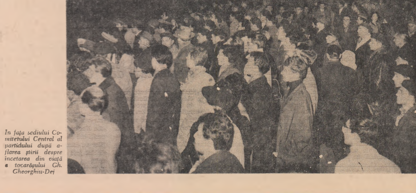
În fața sediului Comitetului Central al partidului după aflarea știrii despre încetarea din viață a tovarășului Gh. Gheorghiu-Dej

Paris PARIS 19 (Agerpres). — Opinia publică franceză a fost informată vineri după-amiază despre tristă veste a încetării din viață a președintelui Consiliului de Stat al R. P. Romine, Gheorghie Gheorghiu-Dej. Televiziunea franceză a transmis în cadrul jurnalului de la ora 20,00 imagini reprezentîndu-l pe tovarășul Gheorghie Gheorghiu-Dej, precum și o scurtă biografie a sa. Posturile de radio au transmis în toate jurnalele știri despre tristul eveniment. Personalități franceze, reprezentanți ai Ministerului Afacerilor Externe au transmis condoleanțe Ambasadei R. P. Romine la Paris.