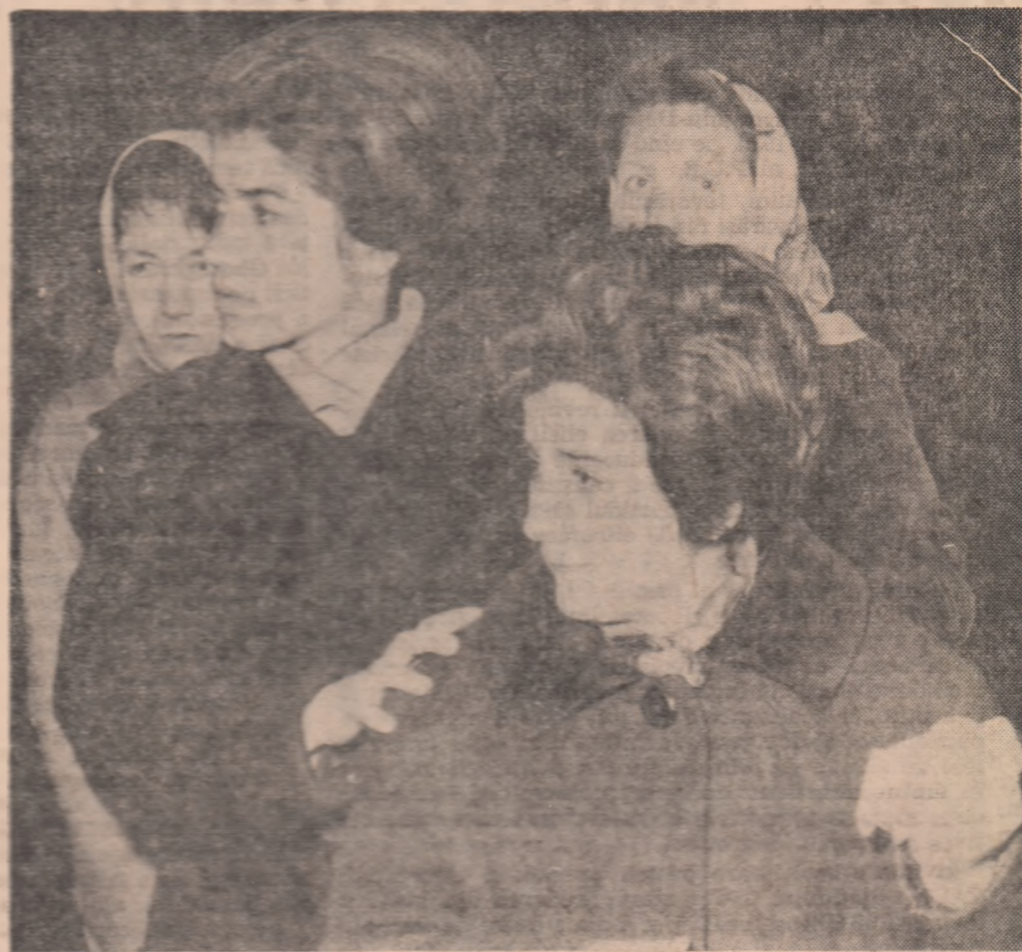
Sintem odinc îndurerati, dar încrederea se clădește uriaș pe imaginea luminoasă pe care ne-a lăsat-o iubitul conducător...