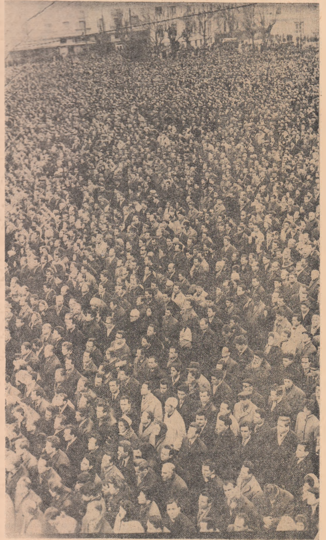
În această dureroasă clipă, toți cetățenii patriei, cu gândurile îndreptate spre partid, spre conducerea sa, se angajează să facă zid de neclintit în jurul partidului, în jurul Comitetului său Central, să nu precupească nici un efort pentru a îndeplini mărețul program al partidului!

Bilanțul bogat al tuturor înfăptuirilor dobîndite este rodul muncii perseverente a eroiceii noastre clase muncitoare, a harniceii țărîni muncitoare, a intelectualității, a întregului popor român, care, sub conducerea și îndrumarea partidului, transpun în viață cu hotărîre neclintită mărețul program al partidului.