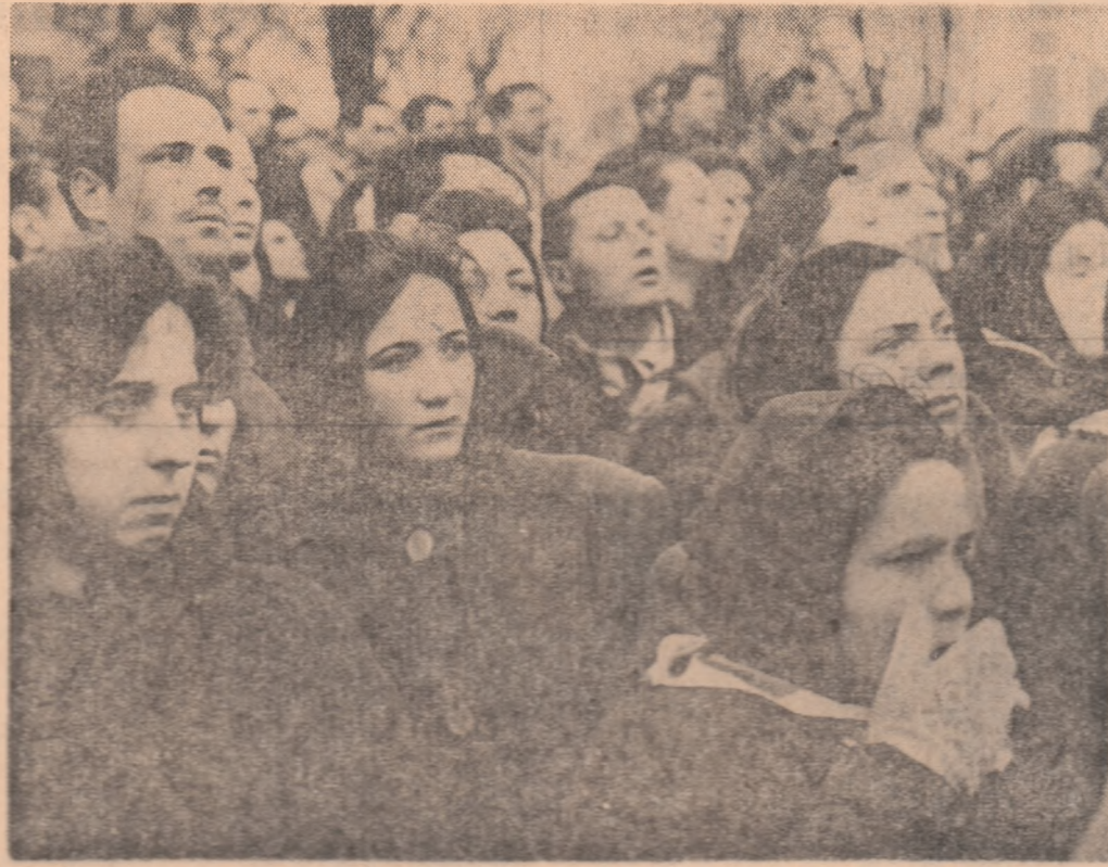
Priviri și inimi îndoliate urmăresc cu tristețe nemărginită trecerea înaltă, dureroasă a cortegiului funerar.

În întreaga regiune Crișana oamenii muncii au luat parte, îndurerat, la tristă solemnitate care s-a desfășurat la sute de kilometri depărtare, în Capitală. Venind de-a dreptul din schimb, numeroși mîneri, șefi de echipă și maștrii de la minele de cărbuni din Șisar, Volevozi, din raionul Marghita, s-au îndreptat spre înălțimea în care se află, cernit, portretul tovarășului Gheorghiu-Dej, pentru a aduce un ultim omagiu celui dispărut. La Oradea și în centrele de raion Belus, Simleu, Salonta, cu multe ore înainte, începînd transmisivitatea, mari mulțimi de oameni așteptau masap într-o tăcere deplină în fața aparatelor de televiziune: în comunele Valea lui Mihai, din raionul Marghita, Camăr și Nușfalau, din raionul Simleu, mii de țărani cooperatori, strînși în jurul televizoarelor și aparatelor de radio, au fost martorii îndureratei și despărțirii de marele fiu al poporului nostru. Amintirea aceluia care, în fruntea partidului și Comitetului său Central a luptat cu atîta dăruire pentru fericirea oamenilor muncii de la sate, ei o vor cinsti prin munca pe ogor, pregătind cu însușețire recolta acestui an.