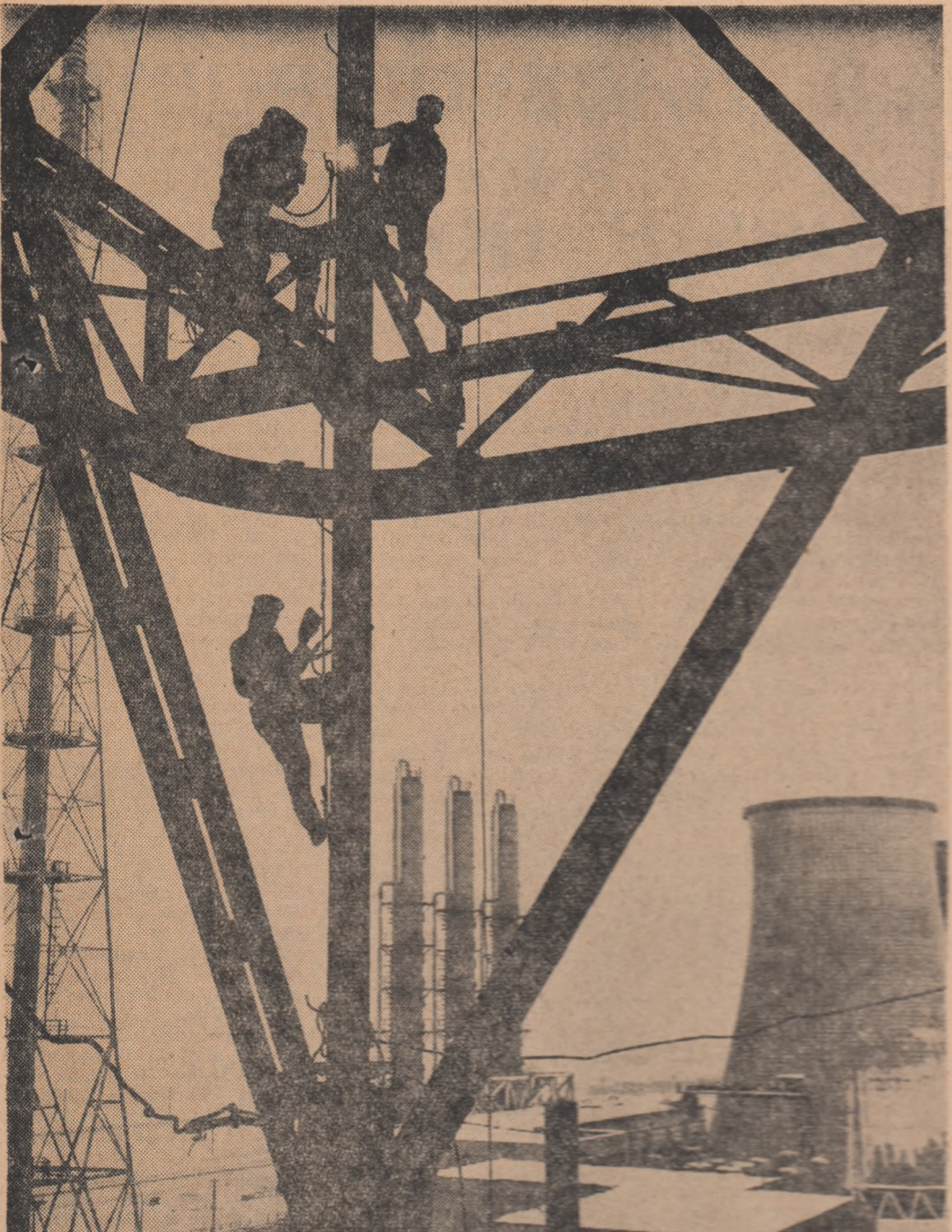
Pe șantierul Combinatului de Ingrășăminte cu azot — Tg. Mures