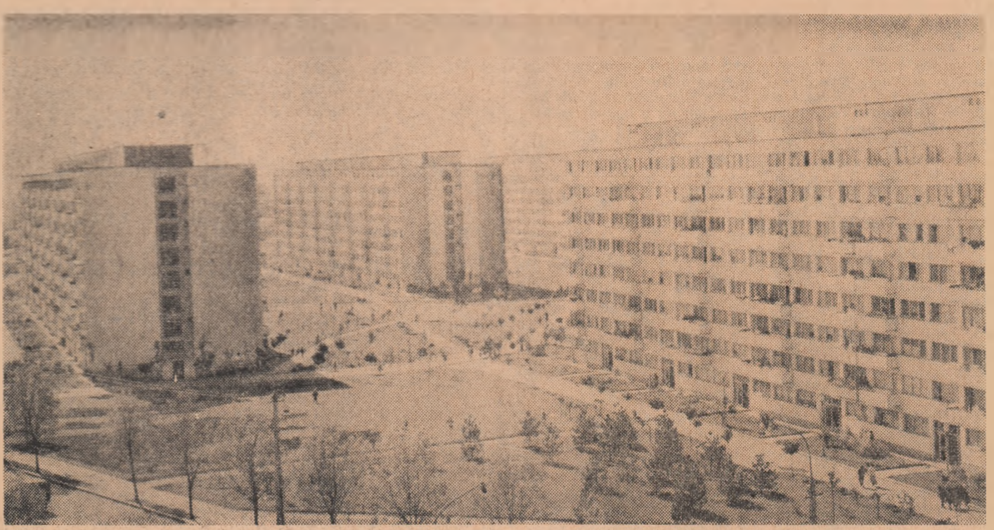
Blocul pe șoseaua Giurgului din Capitală

Cu ocazia sărbătorii naționale a Greciei, rog pe Majestatea Voastră să primească din partea Consiliului de Stat al Republicii Populare Romine și a mea felicitări sincere și urări pentru fericirea dv. și pentru prosperitatea poporului grec.