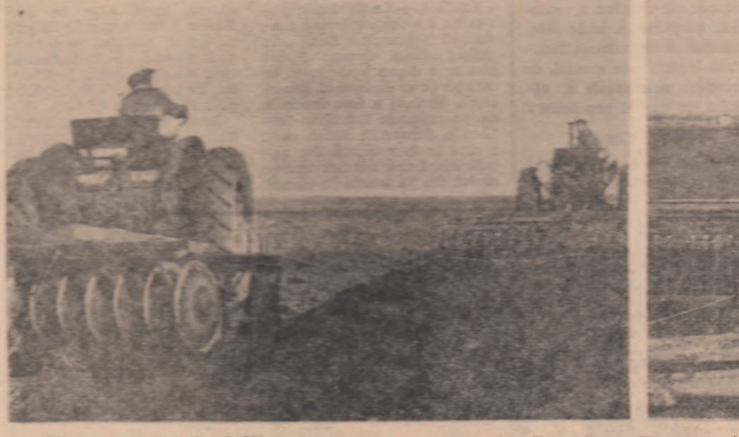
Mecanizatorii de S.G.A.S. Vîrcia, regiunea București, lucrează intens la pregătirea terenului în vederea înălțării de primăvară. În timp ce pentru cultura din epoca a II-a se pregătește patură germinativă, semînăturii culturilor furajere se apropie de sfîrșit.