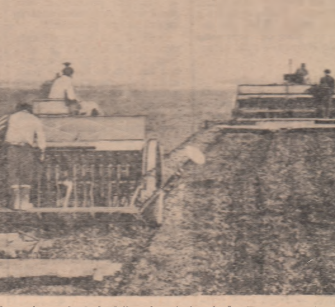
Mecanizatorii de S.G.A.S. Vîrcia, regiunea București, lucrează intens la pregătirea terenului în vederea înălțării de primăvară. În timp ce pentru cultura din epoca a II-a se pregătește patură germinativă, semînăturii culturilor furajere se apropie de sfîrșit.