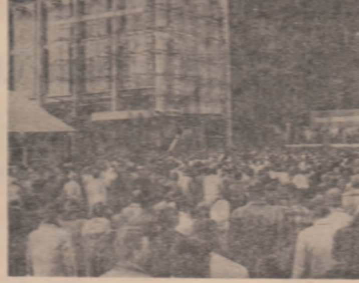
Aspect de la adunarea ce a avut loc la marele Hidrocentral de pe Argeș