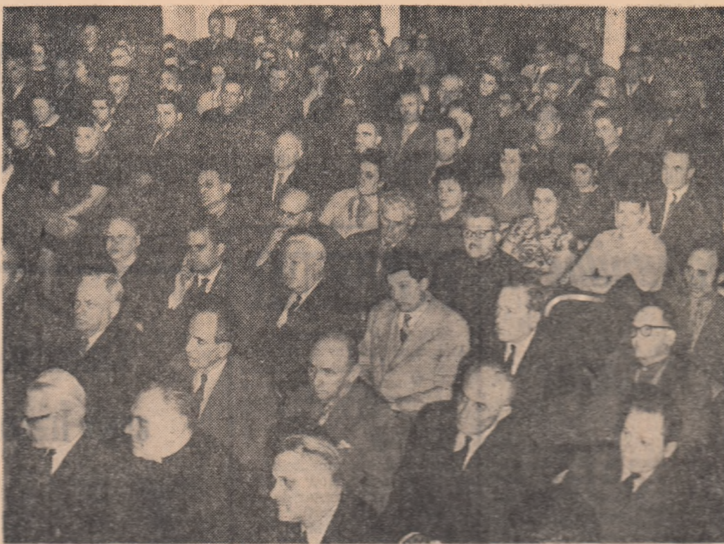
Aspect de la mîntingul din Capitală