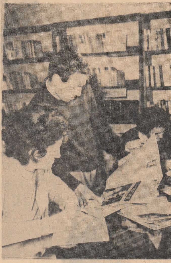
In sala de lectură a bibliotecii ronale din Alexandria