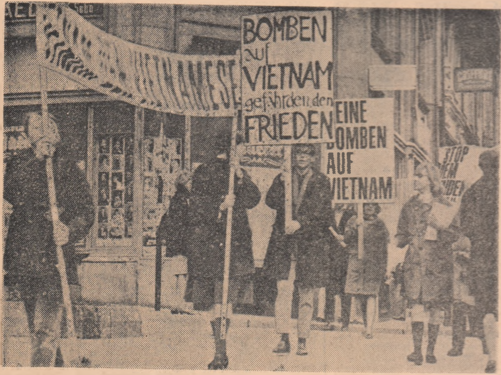
ELVEȚIA. În orașul Basel, zilele trecute a avut loc o demonstrație a liniștii, ca protest împotriva acțiunilor agresive ale S.U.A. în Vietnam. În fotografie: aspect din timpul demonstrației