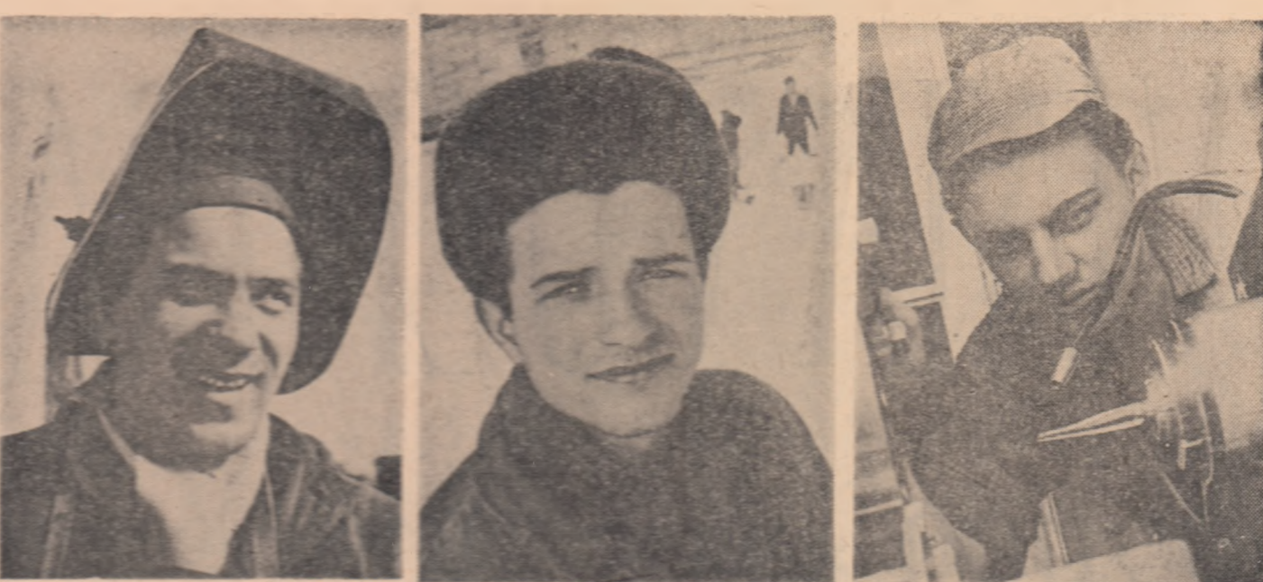
Biblioteca Centrală Regională Hunedoara-Deva