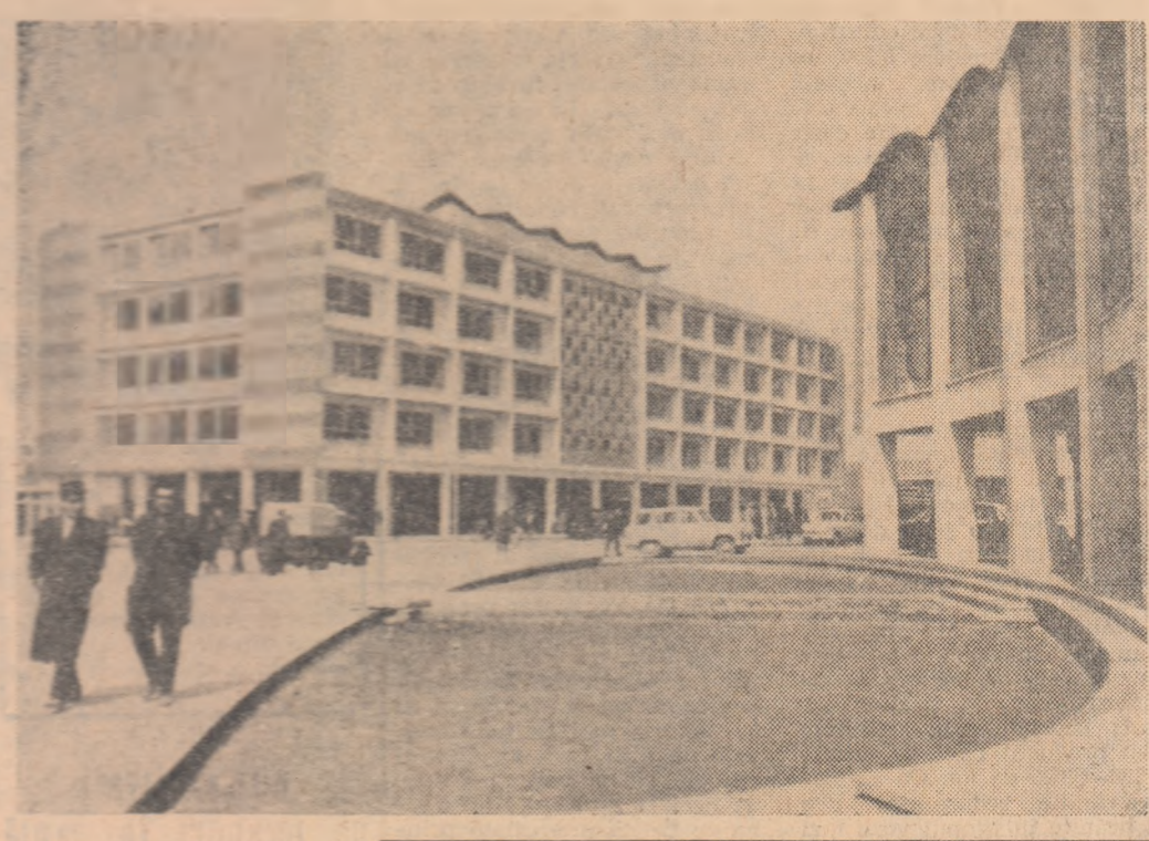
AFGANISTAN. Construcții noi la Kabul, capitala țării

greva studenților venezueleni Un număr de 3.000 de studenți venezueleni au declarat miercuri greve, protestând împotriva înăstrării libertăților democratice. Studenții iau, de asemenea, atitudine împotriva creșterii costului vieții, persecuțiilor studenților progresiști și cererilor de dețineri politice. La chemarea Federației centrelor universitare din Venezuela, studenții din Caracas și din alte orașe ale țării au început, miercuri dimineața, o serie de demonstrații.