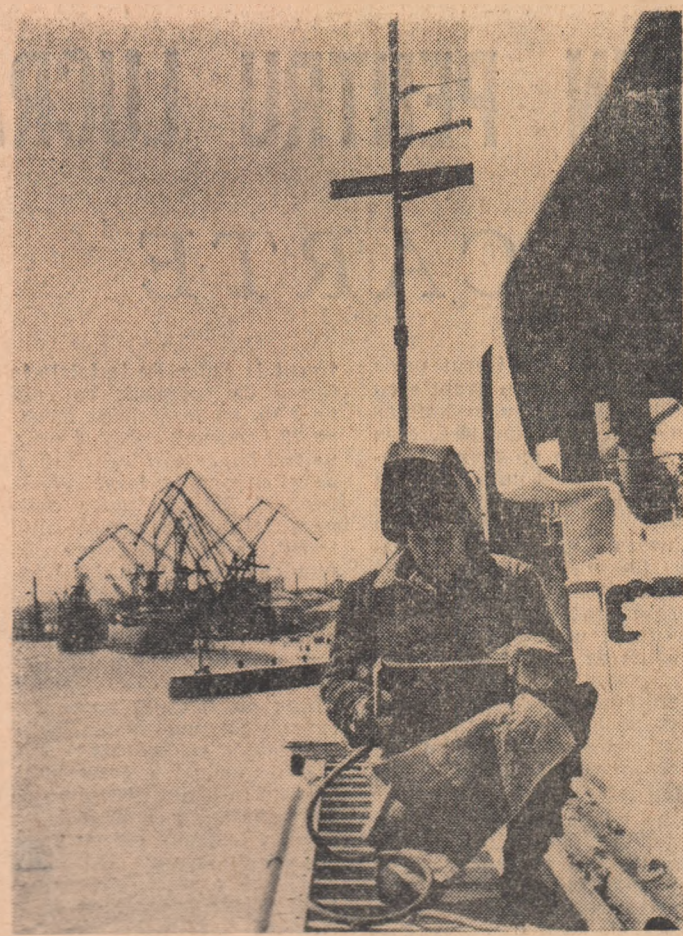
Fier vechi oțelărilor

Cititi pagina a III-a Din viața organizațiilor U. T. M.