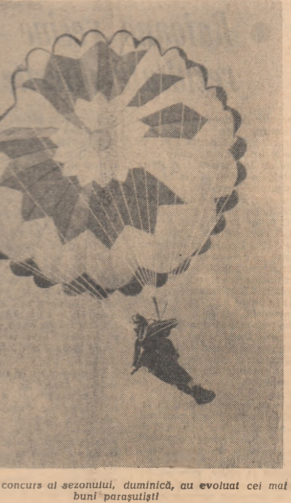
În primul concurs al sezonului, duminică, au evoluat cei mai buni parașutiști.