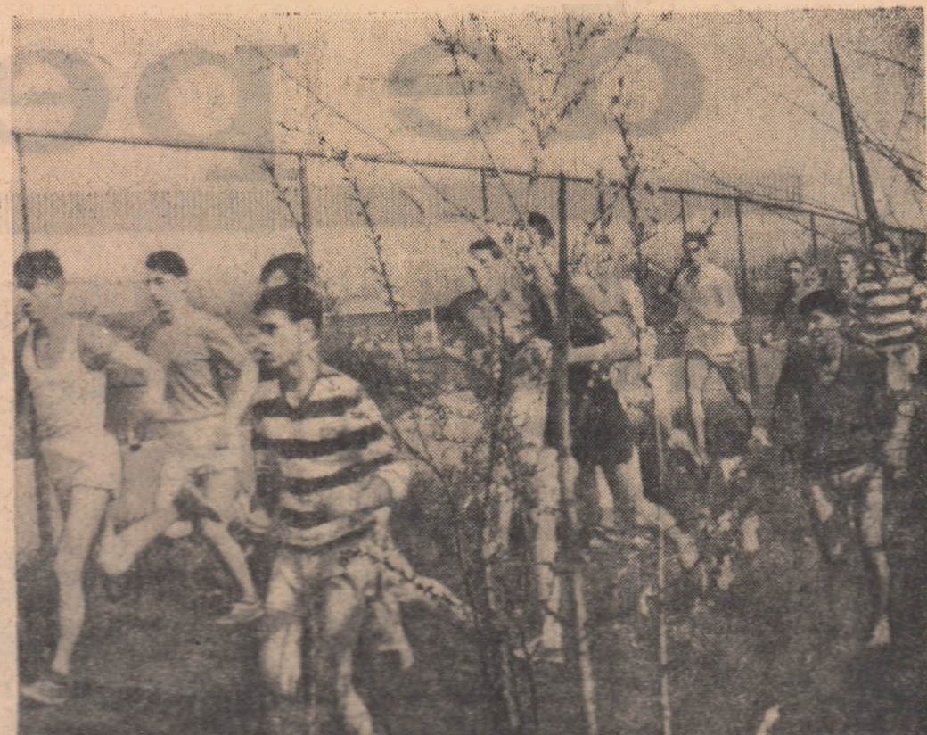
Crosiștii juneori pe parcursul probei

Se dau încă teme de proiect care, prin vastitatea lor, nu pot fi cuprinse în toate detaliile soluțiilor lor în paginile unui proiect realizat într-o durată de lucru relativ scurtă. Alse ori, dimpotrivă, se întindese teme care „circulă” de mai mulți ani, ce-și propun cunoașterea unor instalații și procedee clasice, dezvoltarea mai recentă a industriei noastre chimice (și care sînt sector al industriei noastre chimice în ceea ce privește ritmul dezvoltării și perfecționării și noțiunile aplicate deja în producție rîmîndu-ne oarecum în sfera preocupărilor studenților. Soluția ideală între cele două extreme ar consta,