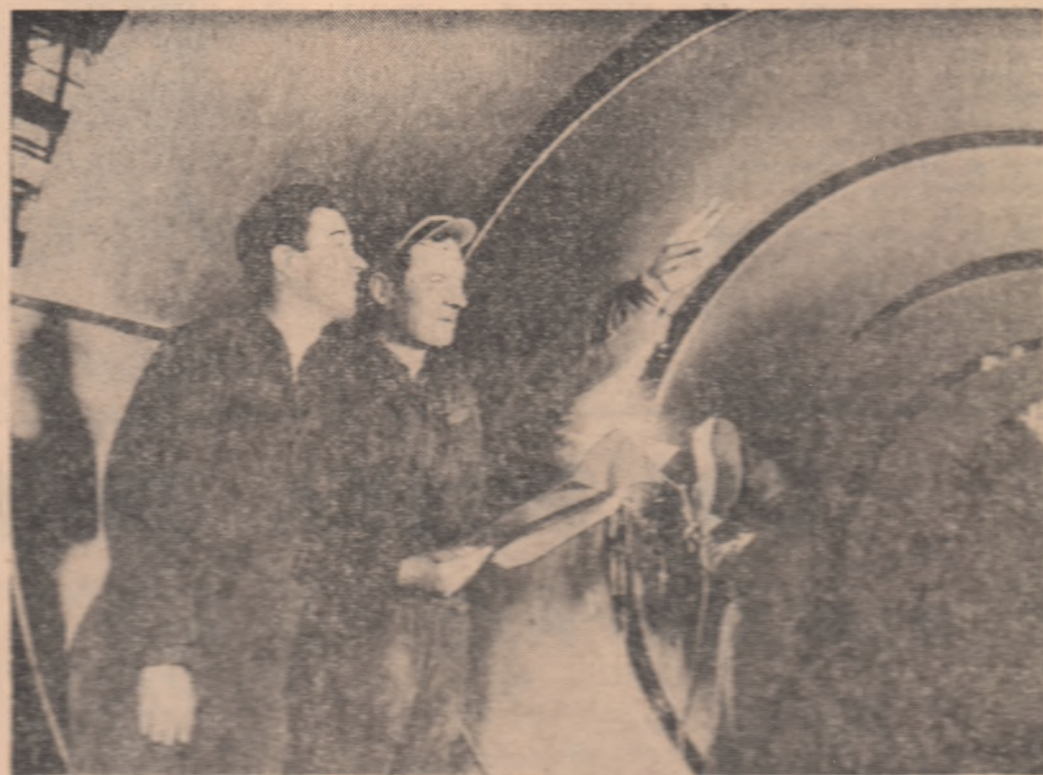
În ședința organizată de la Uzinele „Gheorghe Gheorghiu-Budești” din Capitală

„Scînteia tineretului” (Continuare în pag. a III-a)