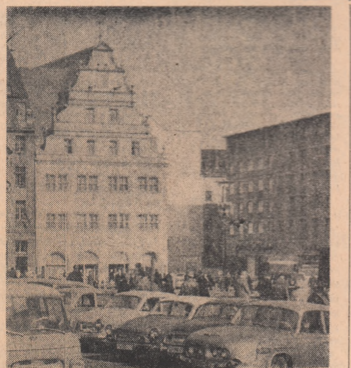
R. D. GERMANĂ. Imagine din Leipzig

În luptele în cursul cărora au pierit, potrivit unor estimări preliminare, sute de persoane, iar numeroase altele au fost rănite, insurgenții, au fost înfrinși, deoarece în sînal mișcării lor au apărut două frecțiuni. Unii erau în favoarea reînnoțirii fostului președinte Bosch, iar alții se opuneau acestei soluții.