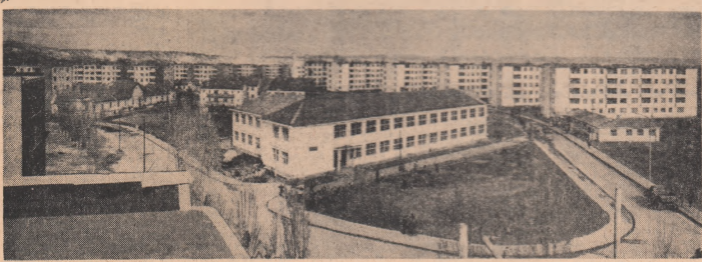
Construcții de locuințe în cartierul Opișani-Turda

Pentru sezonul turistic din această vară se fac intense pregătiri în vederea primirii miilor de oaspeți, iubitori de drumeție. La cabanele din sta- ționa Lacul Roșu — una din- tre cele mai pitorești și frec- ventate zone turistice — s-au executat lucrări pentru îmbu- nătățirea condițiilor de cazare. Astfel, cabanele „Turiztilor”, „Alunșii”, „Cheile Bicazului” și „Suhară”, după ce au fost complet renovate, sînt în curs de dotare cu mobilier modern. De asemenea, lucrări de mo- dernizare se execută la cabane- le „Făget”, „Cheile Turzii” și „Băicoșii”, locuri îndrăgite de excursionsiștii clujești. La cabana „Colibița”, din Munții Căliman, situată în cadrul pu- toresc al unor păduri de co- nifere, s-a mărit capacitatea de cazare cu încă 50 de locuri. (Agerpres)