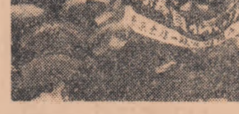
JAPONIA. În iotografie: muncitorii participanți la o recentă demonstrație care a avut loc la Tokio, organizată în cadrul acțiunilor comune de primăvară ale oamenilor muncii japonezi în sprijinul cererii lor pentru majorarea salariilor, pentru stabilirea unui minim garantat al salariilor și pentru lupte de măsură împotriva creșterii prețurilor.