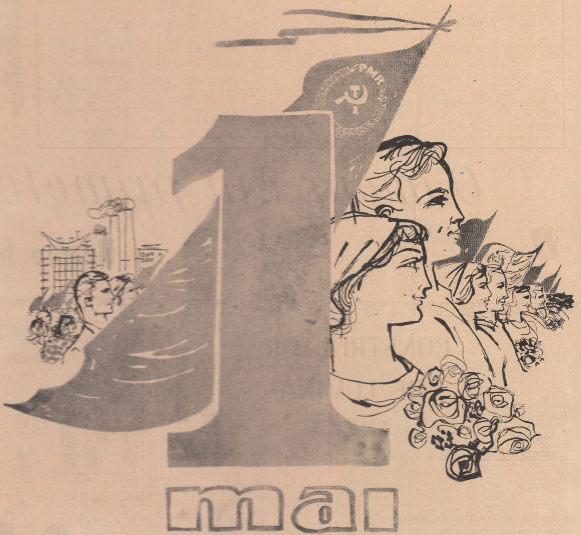
Desen de N. POPESCU