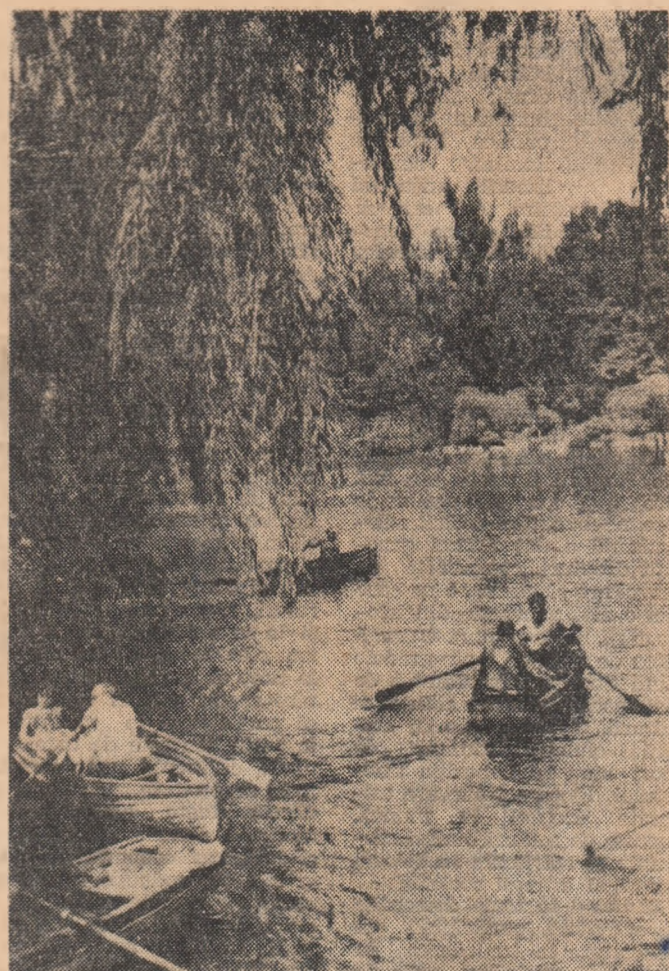
Primăvara pe lac

● În cadrul unei conferințe de presă, ținută în fața ziaristilor sportivi întruîntrii în congres la Budapesta, președintele clubului Benfica Lisabona, Germano, a protestat împotriva hotărîrii U.E.F.A. de a face să se dispute finala „Cupei campionilor europeni” la Milano. Dacă echipa italiană Internațională se va califica în finală, a spus delega-