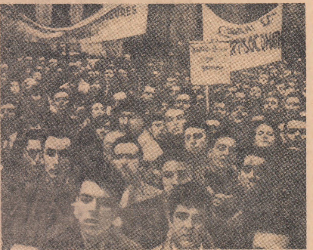
FRANȚA. Aspect din timpul unei recente demonstrații a muncitorilor metalurghiști din Lyon în sprijinul revendicărilor lor