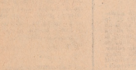
Vedere panoramică a Bratislavei