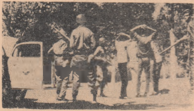
Soldați aparținând trupelor conduse de generalul Wessin percheziționând civili în Santo Domingo

La Washington, purtătorii de cuvânt al Departamentului de Stat au reafirmat miercuri că guvernul S.U.A. nu intenționează să recunoască noul guvern dominican.