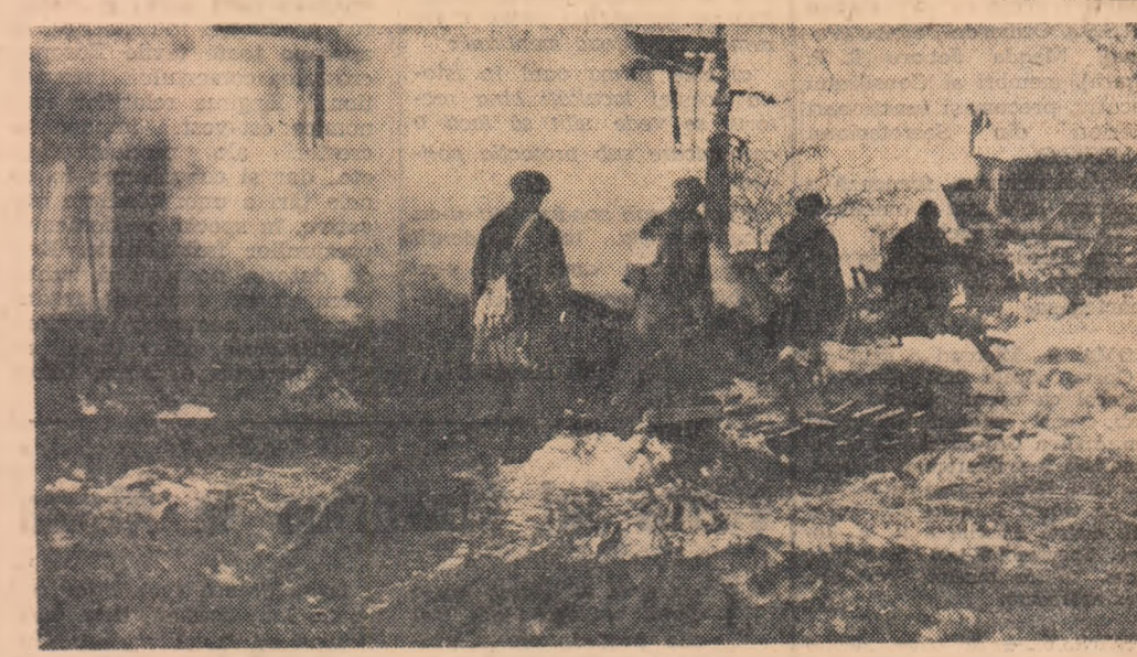
Patula din Divizia 2 munte pătrundînd într-o localitate din Cehoslovacia, incendiată de inamic în retragere

La Viglas, ca de-a lungul întregului drum de luptă al armatei române pe frontul antihitlerist, trupele noastre au săvîrșit noi fapte de vitejie și eroism, aducîndu-și contribuția la înfrîngerea definitivă a Germaniei fasciste și înscrind pagini de neuit în cartea tradițiilor glorioase ale luptei poporului român pentru libertate.