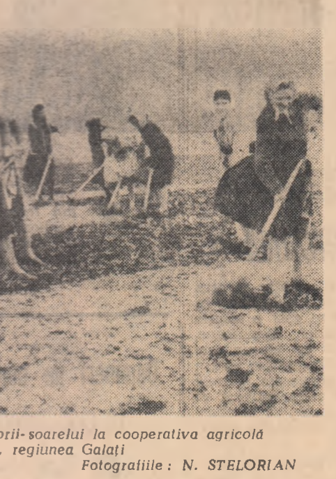
Execuția prășărilor manuale a floarea-soarelui la cooperativa agricolă din Tichilești, regiunea Galați.

— Comparativ cu anul trecut com lășo, la fiecare hectar, cu 1.000-2.000 de plante mai mult. Rîritul se va face o sin-