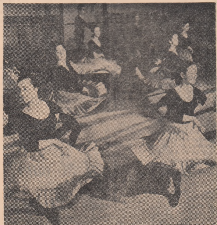
R. P. POLONĂ. — Repetiție la o școală de balet din Varșovia.

HANOI 11 (Agerpres). — În ziua de 10 mai, avioane americane și sud-vietnameze au bombardat și mitraliat regiuni populate situate de-a lungul șoselelor din provincia Thanh Hoa, provincia Ha Tinh și insulele Hon Mat și Con Co, din apele teritoriale ale R. D. Vietnam. Șeful misiunii de legătură a Inaltului Comandament al Armatei Populare Vietnameze a înaintat Comisiei internaționale de supraveghere și control un protest în legătură cu noile acțiuni agresive asupra teritoriului R. D. Vietnam. Raporturile preliminare arată că unitățile Armatei Populare Vietnameze au doborât un avion inamic, avariînd altele.