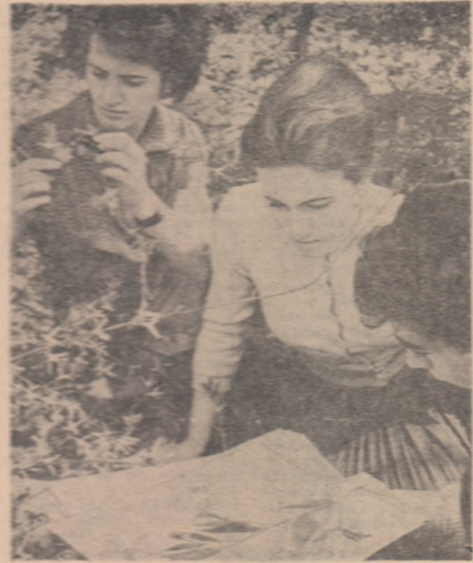
Gădina botanică din Capitală... studenții de la Facultatea de științe naturale