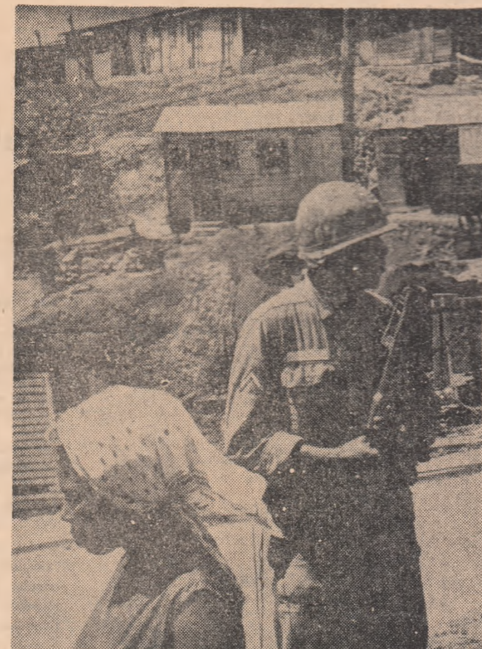
REPUBLICA DOMINICANĂ. — Militar american din trupele intervenționale pe una din străzile orașului Santo Domingo.