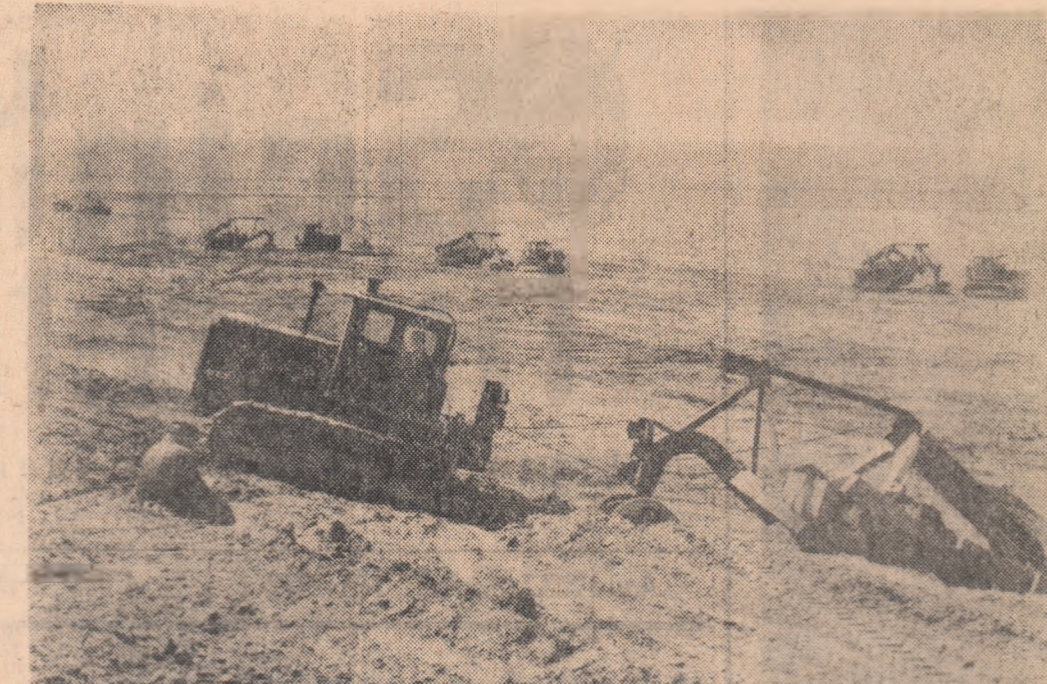
La Braștov de Sus, regiunea Galați, se execută lucrări de îndiguire a 15.000 de hectare

Demonstrații practice organizăm și cu muncitorii A.M.C.-iști și cu laboranții. Așa, de pildă, laboranții din secția, care au rolul de a urmări procesul de fabricație pe faze, sint trimiși, prin rotație, săptămînal, la laboratoarele centrale unde urmîresc pe scară de laborator întregul proces tehnologic, participînd totodată alături de personalul de atîta în înțelegerea sa se aduce.