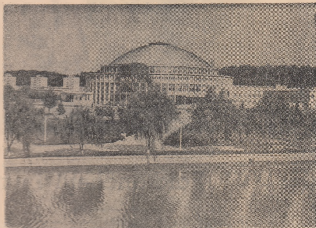
R. P. D. COREEA-NĂ. — Noi construcții împodobește peisajul Phenianului