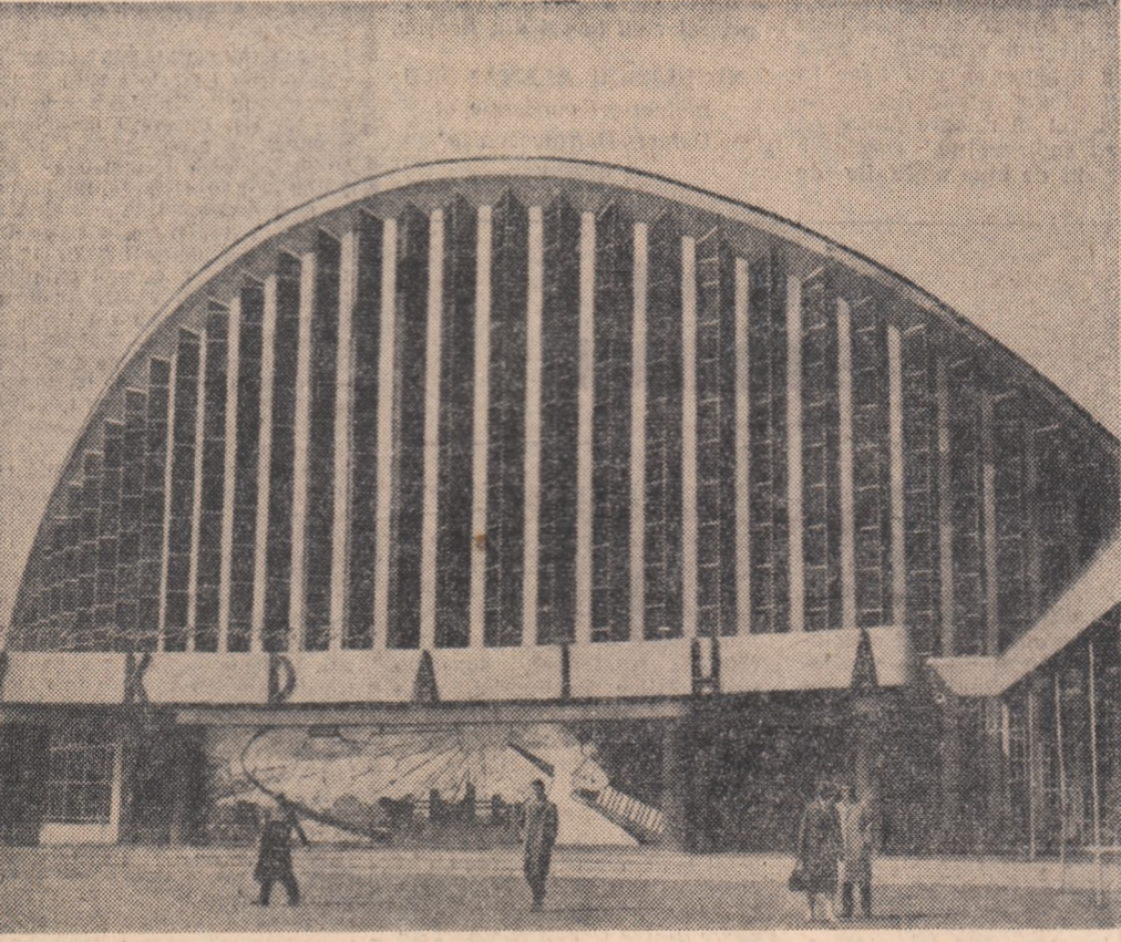
U.R.S.S. — Palatul „Ucraina” din Harkov, clădire cu o construcție originală a cărei sală de concerte are circa 2.000 de locuri.

HANOI. — După cum transmite Agenția Vietnameză de Presă, la 14 și 15 mai numeroase grupuri de reacționari din recunoșterea americană au pătruns în spitalul aerian al R. D. Vietnam pentru a desfășura activități de spionaj deasupra mai multor provincii.