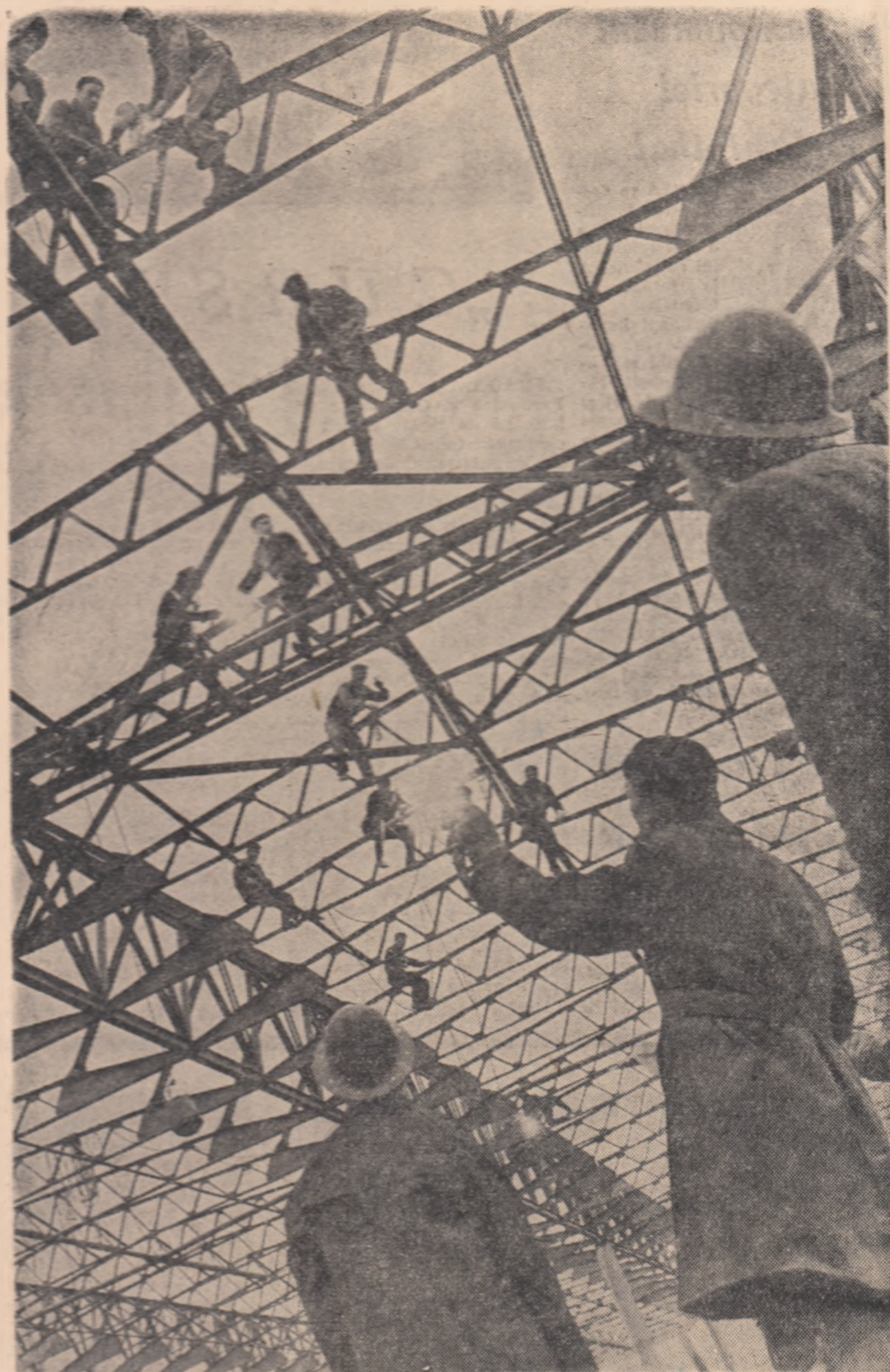
Construcții metalice. — Acoperișul unei noi hale ce se construiește la Uzinele „Electroputere”-Craiova.