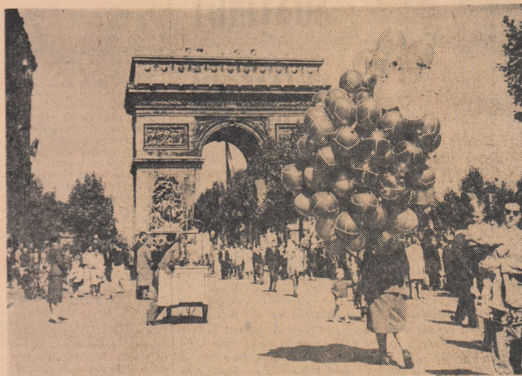
FRANȚA: Zi de primăvară la Paris