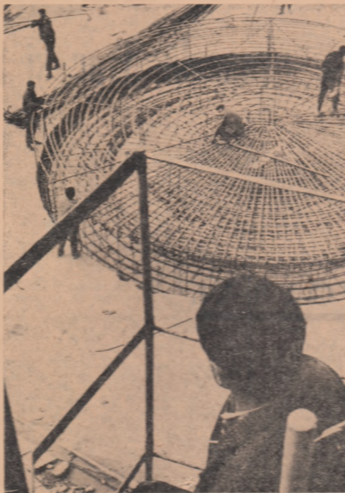
Imagini de pe montajul noului Fabricii de ciment de la Tg. Jiu

Dintre măsurile tehnico-organizatorice, care vor contribui la realizarea angajamentelor, enumerăm: montarea a 6 funducule pentru scos-apropiat; instalarea a două încălzitoare mecanice; darea în funcție a 17,7 km drum-auto-forestier, sistematizarea a două depozite finale.