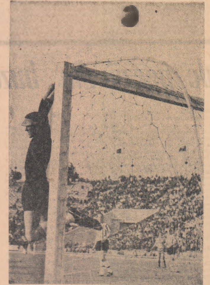
Portarul formației „Sparta” Rotterdam, salvează în extremis

acum notele de drum — ca să le spun astfel — culesse din călătoria prin frumusețe, cum merită cu prisosință să fie numită inițiativa Grupului școlar profesional de construcții și montaj. (Text continues with the poem/article.)