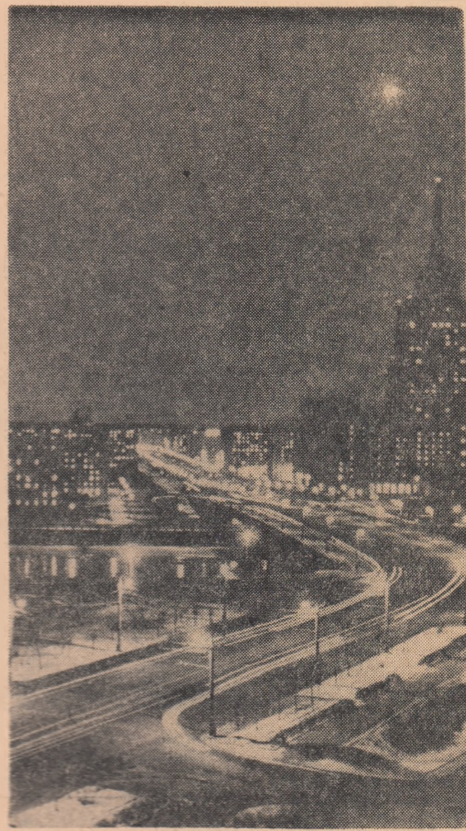
U.R.S.S. — Noaptea de bulevardul Kutuzov din Moscova

Potrivit recomandărilor Comitetului, Congresul mondial se va desfășura între 10 și 17 iulie la Helsinki. La lucrările sale sînt invitate cele mai diverse curenturi ale tuturor forțelor lămuritoare de pace din lume.