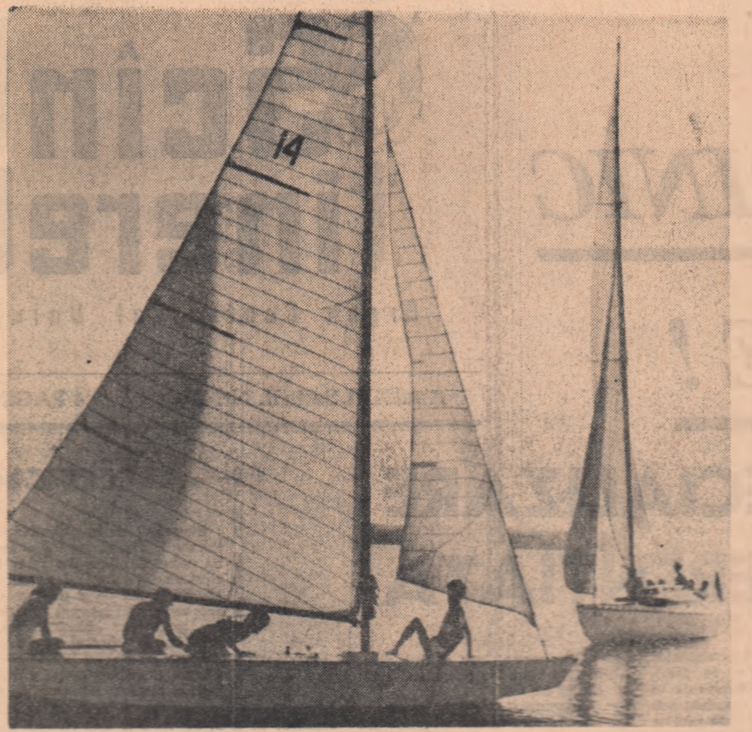
Cu iolele pe lac