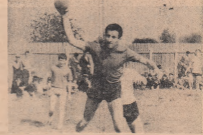
O grup de sportivi din cadrul echipei noastre, în timpul antrenamentelor.

Cea de-a 18-a ediție a „Curselor Păcii” s-a desfășurat în ziua de 24 mai 1965, la ora 18.00, în Sala de Sporturi din București. În cadrul acestei competiții s-au desfășurat două meciuri de box, care au avut loc în Sala de Sporturi din București. În cadrul acestei competiții s-au desfășurat două meciuri de box, care au avut loc în Sala de Sporturi din București.