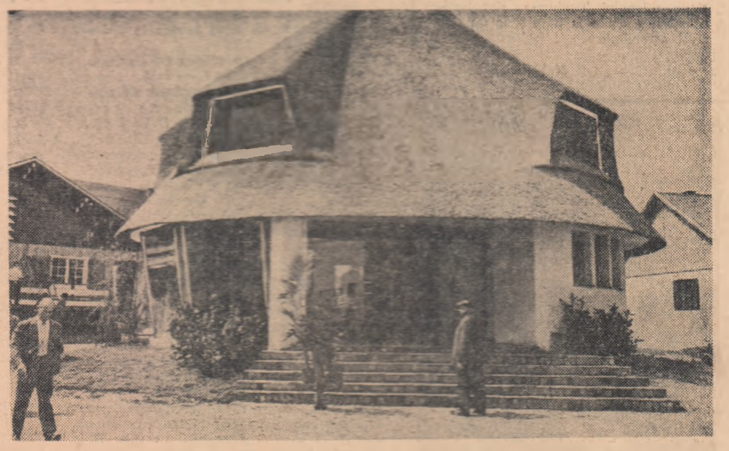
FRANȚA. — „Căsuța” Parisului, la Tîrgul anual din capitala franceză

După cum transmite agenția vietnameză de presă, în cursul raidurilor efectuate de forțele aeriene ale S.U.A. asupra teritoriului R.D. Vietnam, în zilele de 19, 20 și 21 mai, forțele aeriene locale au doborât 10 avioane. Numărul total al avioanelor americane doborîte în spațiul aerian al R.D. Vietnam, începînd din 5 august 1964, se ridică la 295.