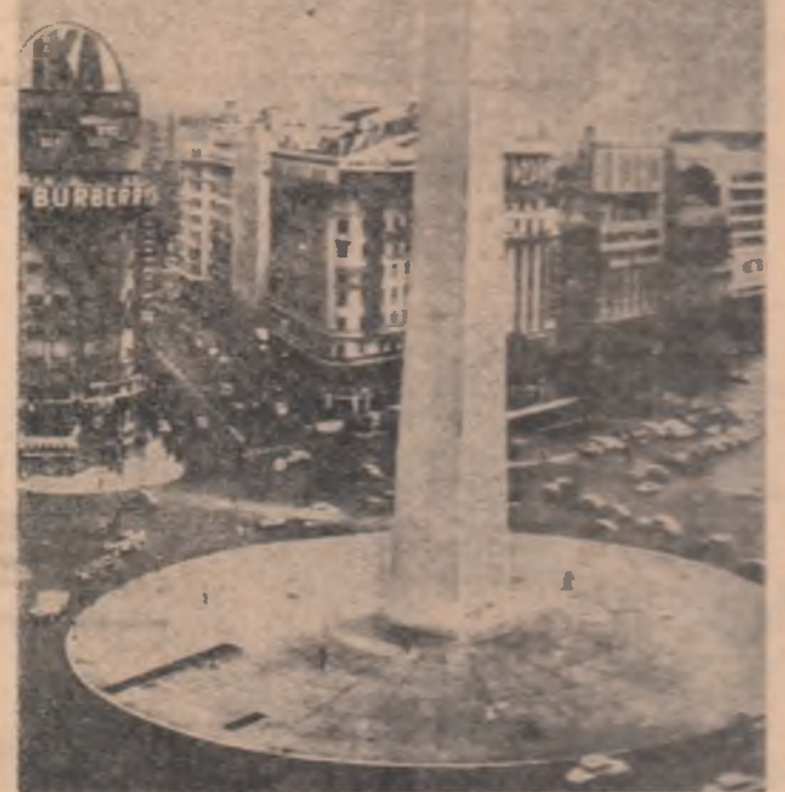
ARGENTINA. — Vedere a unei piețe centrale din Buenos Aires

AL. GHEORGHIU Correspondentul Agerpres la Paris