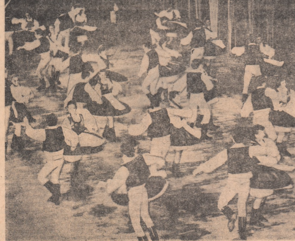
Echipele de dansuri a Fabricii de mobila „23 August” din Tg. Mures