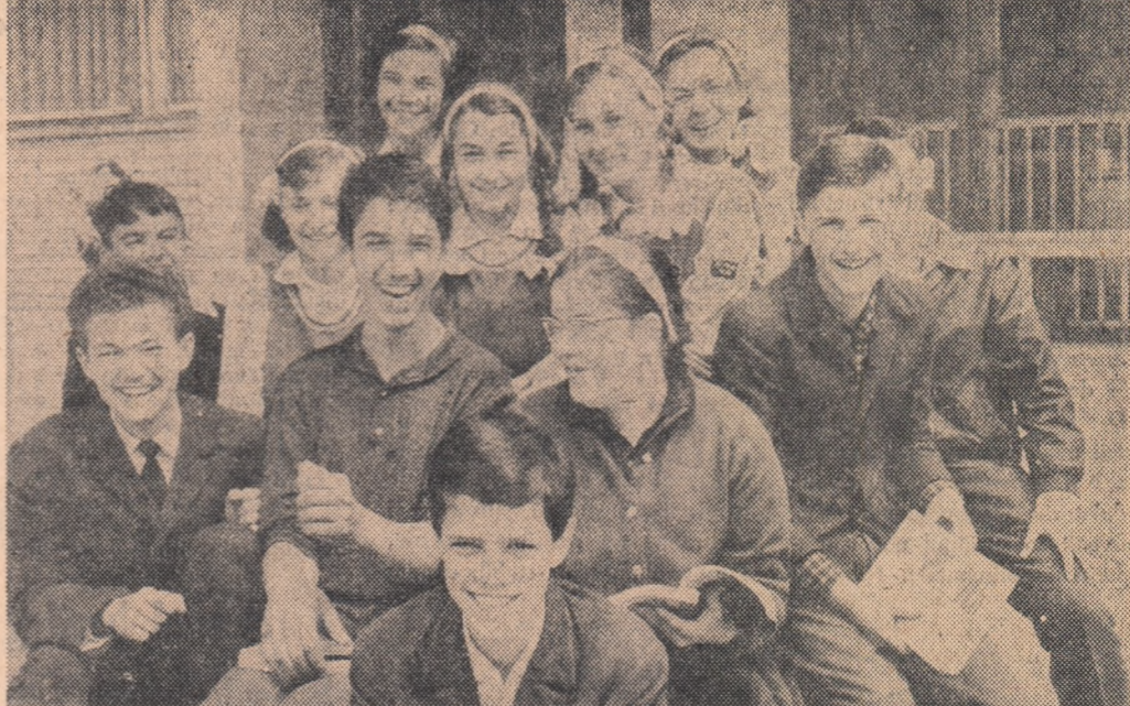
Fotografie pentru albumul promoției (un grup de absolvenți ai clasei a VIII-a a Școlii medii nr. 24 din Capitală)