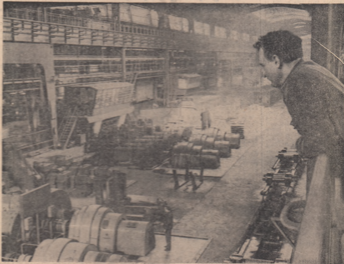
Unul de laminare al liniei continue de sîrmă de la Combinatul siderurgic Hunedoara