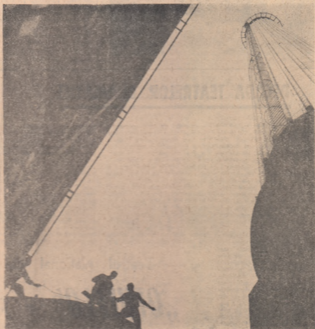
Pe șantierul termocentralei Fintinele, în aceste zile se deslășoară o muncă susținută în vederea punerii în funcțiune a noilor agregate energetice înaintea termenului. Construcția de pe acest șantier ar fi terminată cu 15 zile mai devreme turnarea fundației cazanului de la grupul de 100 MW. Au început de asemenea, și lucrările de construcție la camera de comandă, la stația de tratare și la cele două turnuri hiperbolice de răcire.