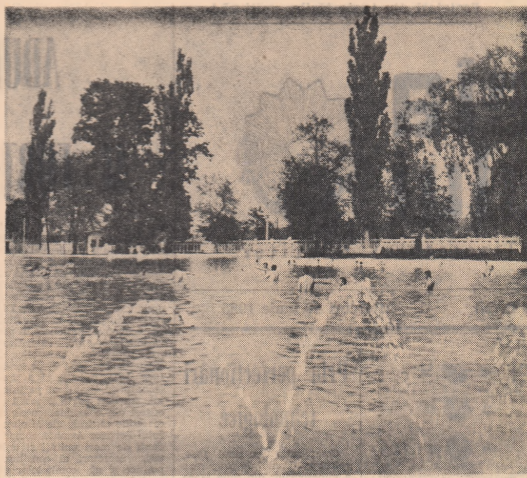
Ștrandul cu apă termală din stațiunea balneară „Victoria”-Oradea

● În cadrul Decadei teatrelor dramatice, colectivul Teatrului de stat din Piatra Neamț a prezentat marți seara piesa „Nu sînt Turnul Eiffel” de Ecaterina Oproiu.