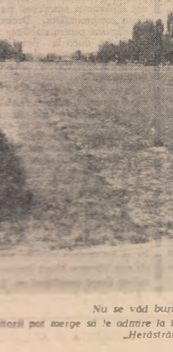
Nu se văd buruienile?

Mureșan” mi-e foarte simpatică. Mai ales de cînd am descoperit că atunci cînd gesticulează, inscrie în aer ceva din spirala telului de băut spumă”. Știe să concentreze cu exactitate observații generalizatoare: „Bucuria simplității relațiilor dintre oameni, pentru a se putea manifesta din plin. — Cred că într-o bucurie generală, oamenii nu se pot ierter-hiza. Numai în durere oamenii se consideră ierarhizati... Există un orgoliu al durerii”. Încă nu are însă pe deplin înțelegerea gradului infimptor și a înțelegerii localei comu-tern, și forțază uneori unii descrie în retrospectivă starea post-avertis. Și încă dăm în scadală de reportaj mai puțin convinșător, veritabile, proiectate în viitor pe care le înțelegem personajele. Aici, li-cida puzure în pagină și inlocuște de multe ori de verbiș.