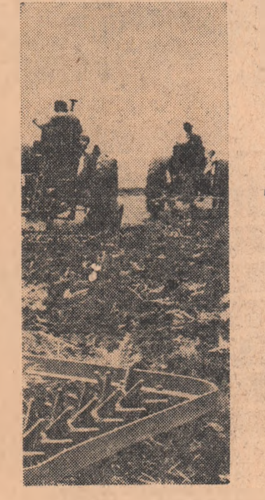
Pe terenurile de unde s-a recoltat secata pentru masă verde, membrii cooperativei agricole de producție din comuna Movilfa, raionul Urziceni, arădămintul în vederea însămînțării porumbului siloz.

De activitatea care se desfășoară aici pentru lucrările navei, inginerul Ion Mîndru. (La ora cînd apar aceste rânduri, nave se află deja la cheiul de armare al sectorului II). Avansate sînt și lucrările de la șlepurile 6 și 7, iar al treilea vas maritim va fi lansat înainte de termenul prevăzut în angajamentul reînnoit.