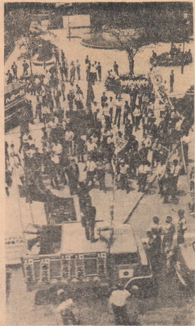
JAPONIA. Aspect de la începerea Parla-mentului japonez în Camera superioară a Parlamentului japonez

Desi cu o alipi-mă în urmă, Japonia, pe lângă armamentului militar electric, are în prezent în parlament o lege de publicitate care se dea publicității rezultatele anchetei comisiiei de anchetă în „afacerea Mirage” în privința gumei, sub presiunea cerurilor parlamentare și a numeroase organe de presă, să-și determine să-și revizuiască atitudinea. „Scandalul Mirage”, după cum se știe, a fost declanșat de dezbaterile parlamentare care au pornit de la cererea privind acordarea unor credite în valoare de 576 milioane de franci, ce trebuiau să se adauge sumei inițiale precăutate pentru achiziționarea unor avioane de luptă („Mirage III”) de la firma franceză „Dassault”.