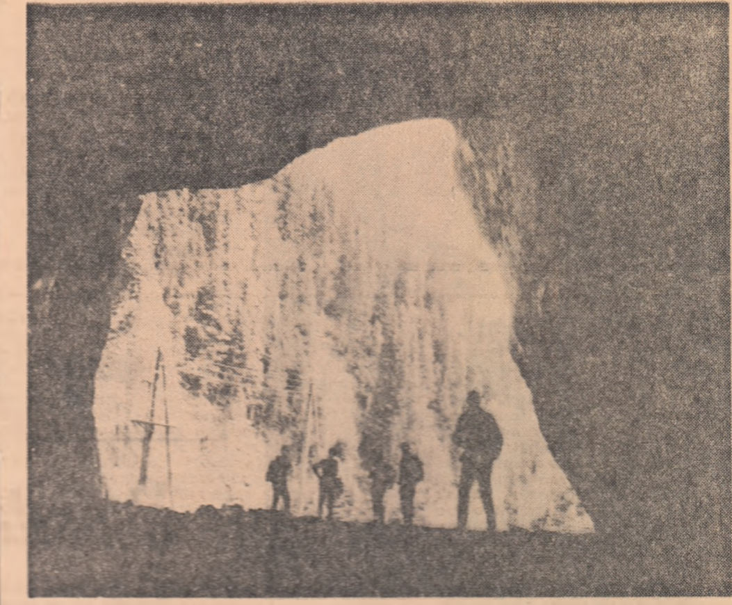
La intrarea în peștera Ialomicioarei, din Munții Bucegi