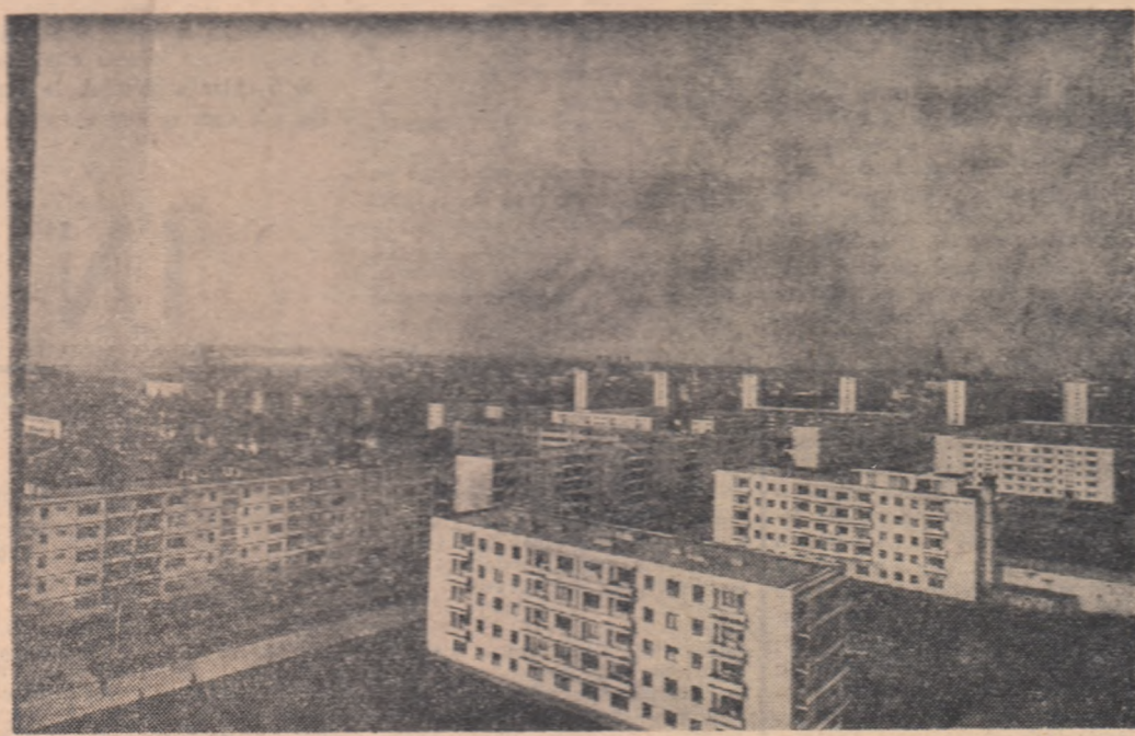
Vedere asupra cartierului „Dimitrie Cantemir” din Iași