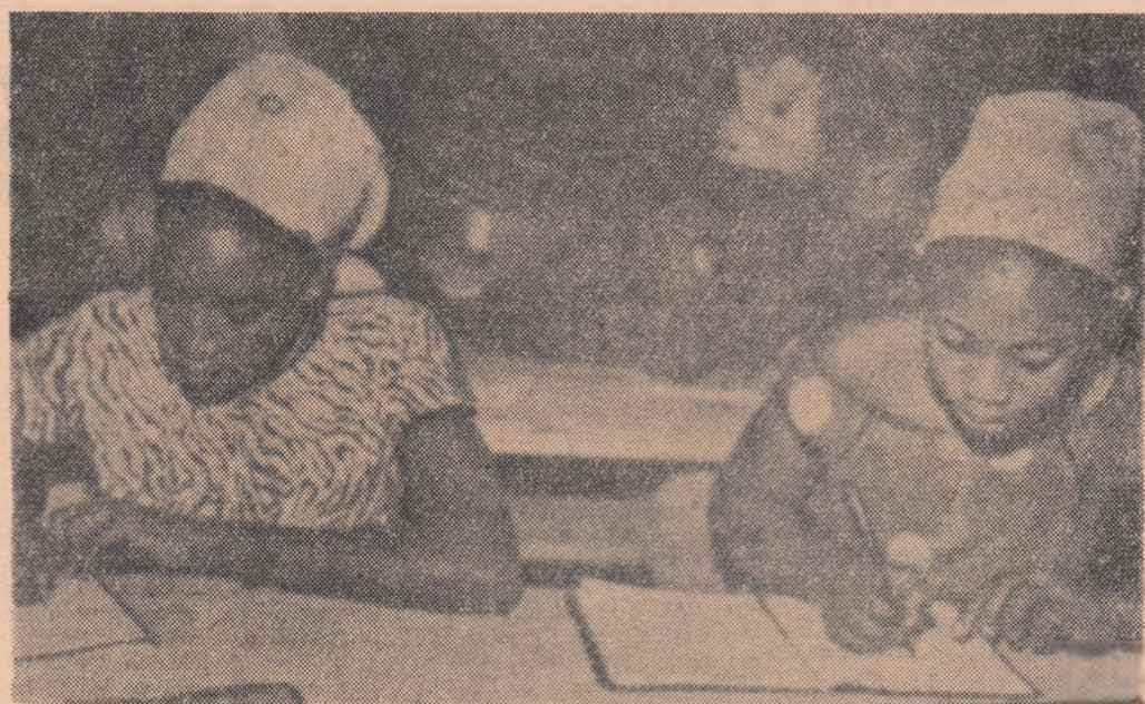
REPUBLICA MALI. În timpul unei ore de curs la o școală din Bamako, capitala țării

putere în țară. Comunicatul poartă semnătura colonelului Houary Boumediene, care a deținut pînă în prezent funcțiile de prim-vicepreședinte al Consiliului de Miniștri și ministru al apărării. În comunicat se arată că au fost luate măsuri pentru a asigura ordinea, securitatea și funcționarea în continuare a instituțiilor existente, că Consiliul se va ocupa de reorganizarea și redresarea economiei țării, și că Algeria va respecta angajamentele contractate pînă acum pe plan internațional. Sint de asemenea expuse motivele înlăturării președintelui Ben Bella, care este învinuit, printre altele, de exercitarea puterii personale.